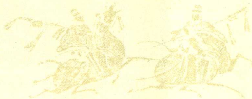
图 说 天 下 | 国学书院系列