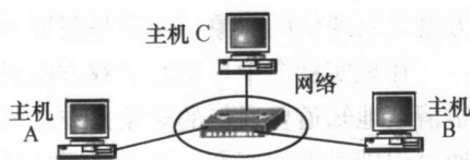
图 1-1 网络安全示意图