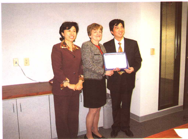
公派留学赴美国加州州立富乐敦大学（Fullerton） 获高级公共管理结业证书（2006年1月美国加州）