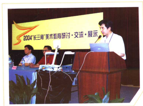
在“长三角”美术教育教学研讨会上发言(2004年6月上海)