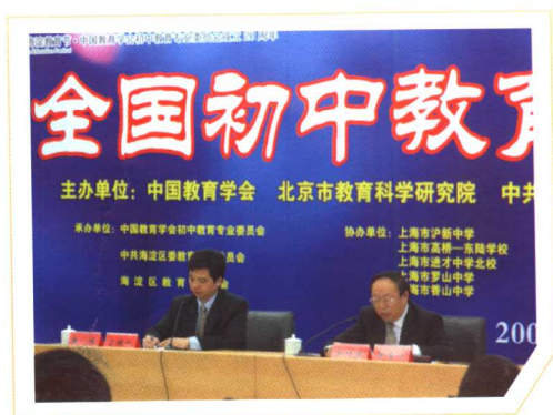
主持全国初中教育校长论坛 (2006年10月北京)