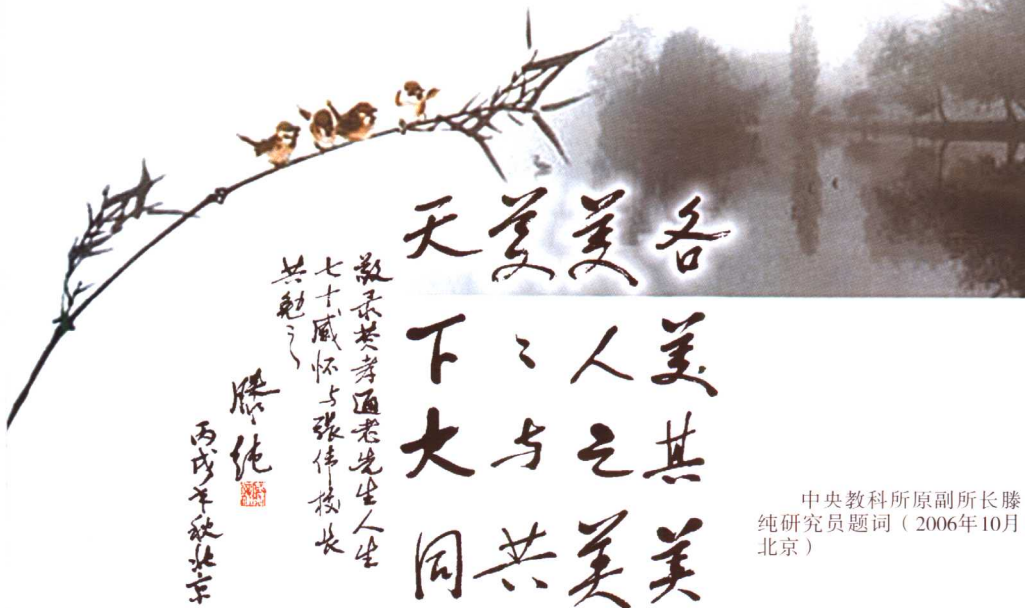
中央教科所原副所长滕纯研究员题词（2006年10月北京）