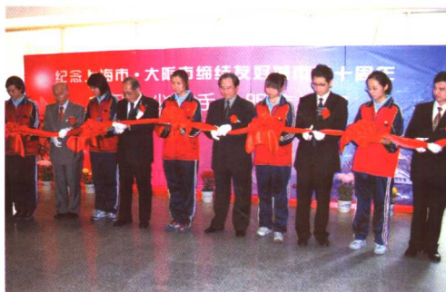
2004年11月上海市香山中学