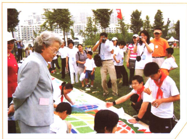
上海市政协副主席谢丽娟考察香山中学美术社团活动 (2004年6月)