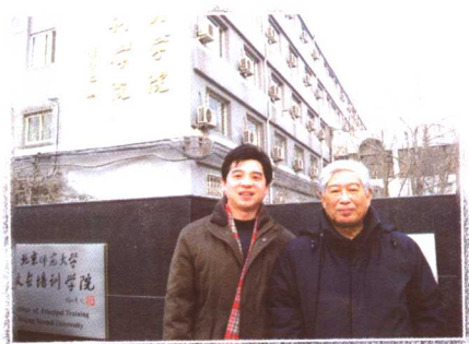
与中国教育学会会长顾明远先生合影 (2007年1月北京)