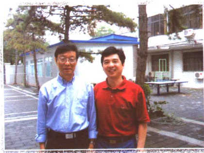
与中国教育学会常务副会长谈松华先生合影 (2006年7月北京)