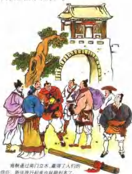
商鞅通过南门立木，赢得了人们的信任，新法推行起来也就顺利多了。

此后，秦国日益强大起来，商鞅也因功被封在高地，被人尊称为商君。但是商鞅变法的措施太过苛刻，自己又不积德政，不仅得罪了旧势力，也失去了许多人的支持。秦孝公死后，商鞅全家被杀死，商鞅也被车裂分尸。