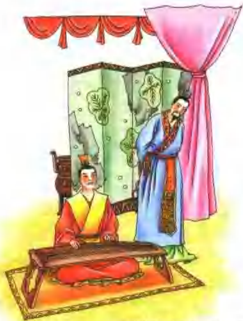
邹忌借弹琴之道进谏，齐威王开始有所感悟，决心用心治国。

家大事。邹忌说：“要想治理好国家，关键在于国君和辅臣在执行政令时，要像四时运转一样协调。”齐威王很欣赏邹忌的见解，就任命他为相，让他整顿朝政，改革政治。此后，齐国国政开始逐渐好转。