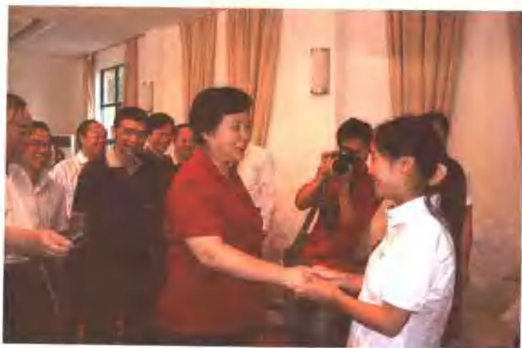
湖北省副省长蒋天因（中）亲切接见刘芳艳及事迹报告团成员