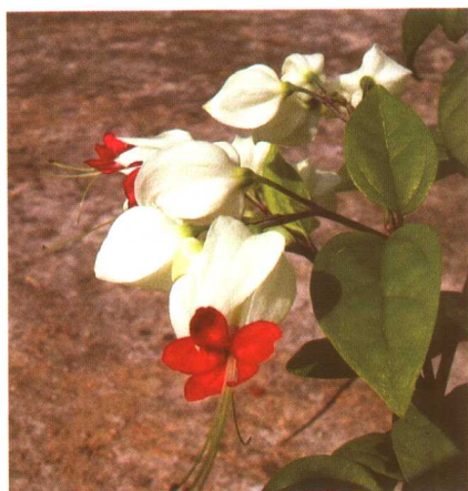
图 2-2-59 龙吐珠