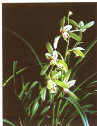
图 2-2-44 建兰