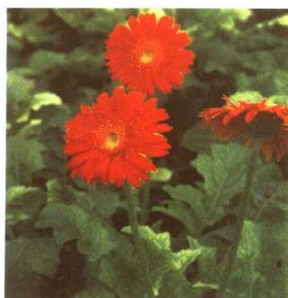
图 2-2-11 非洲菊