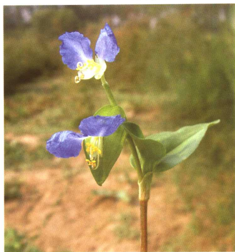
图 2-2-18b 紫露草