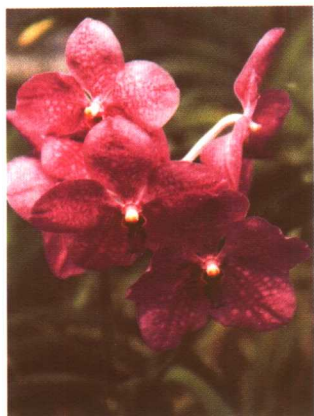
图 2-2-51 棒叶万带兰