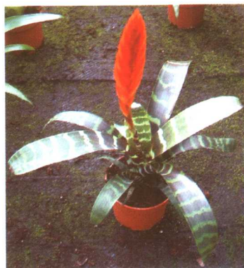
图 2-2-25 丽穗凤梨