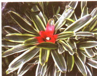
图 2-2-24 赭凤梨