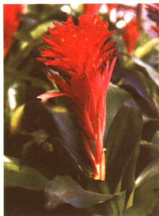
图 2-2-26 水塔花