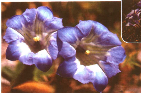
图 2-2-54 龙胆