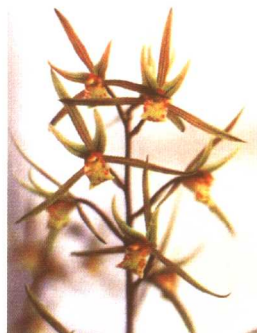
图 2-2-46 寒兰