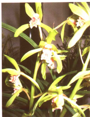
图 2-2-43 蕙兰