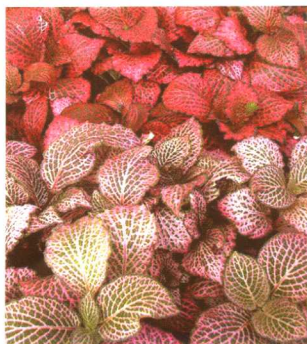
图 2-2-21 红网纹草