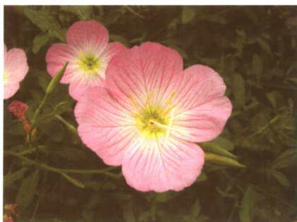
图 2-2-4 月见草