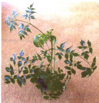
图 2-2-69 菜豆树