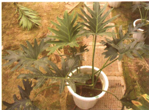
图 2-2-31 春羽