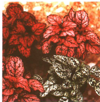
图 2-2-22 枪刀药