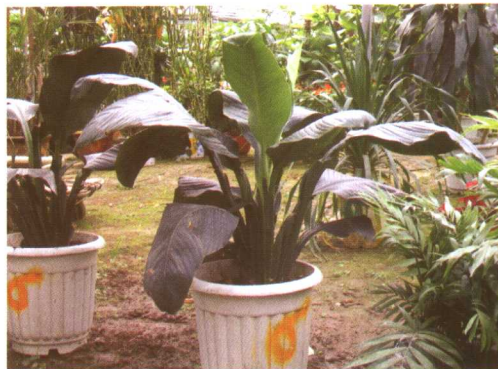
图 2-2-32 白鹤芋