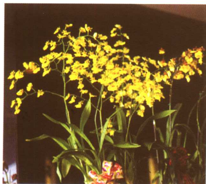
图 2-2-48 文心兰