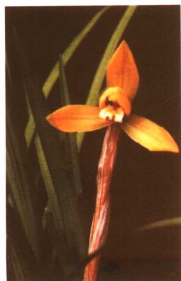
图 2-2-42 春兰