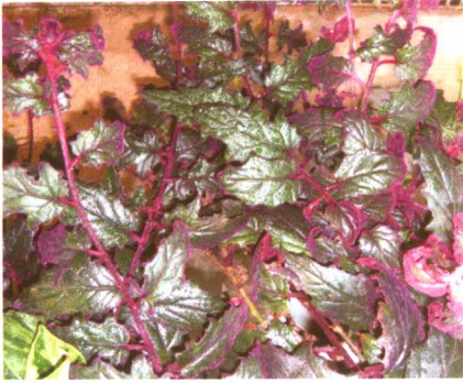
图 2-2-12 紫鹅绒