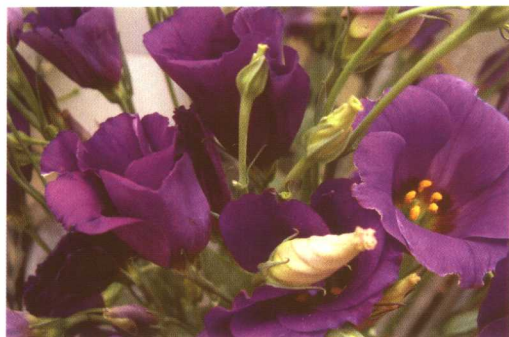
图 2-2-8 草原龙胆