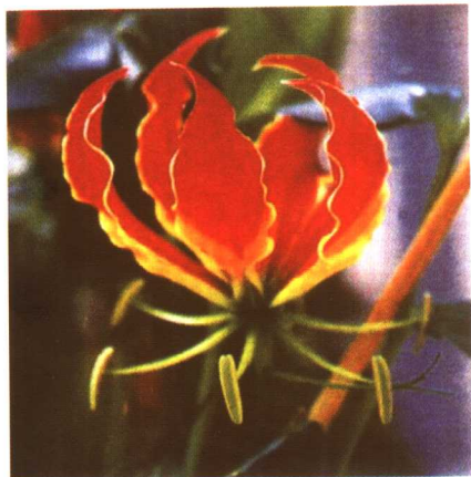
图 2-2-57 嘉兰