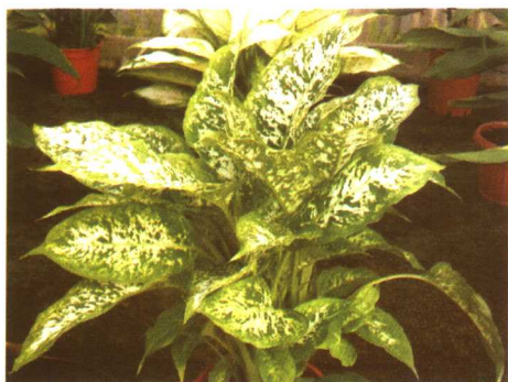
图 2-2-28 花叶万年青