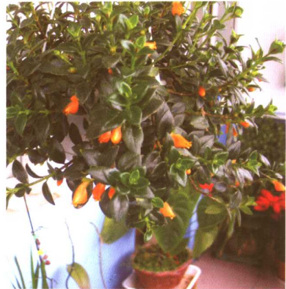
图 2-2-15 袋鼠花