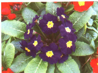
图 2-2-60 非洲紫罗兰