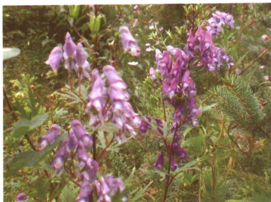
图 2-2-65 乌头