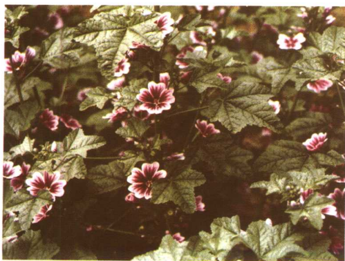
图 2-2-5 锦葵