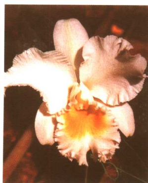
图 2-2-49 卡特兰