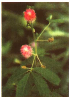
图 2-2-66 含羞草