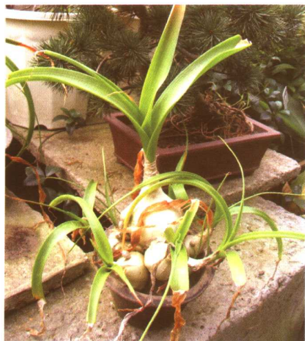
图 2-2-33 虎眼万年青 (海葱)