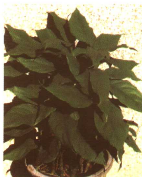
图 2-2-29 广东万年青