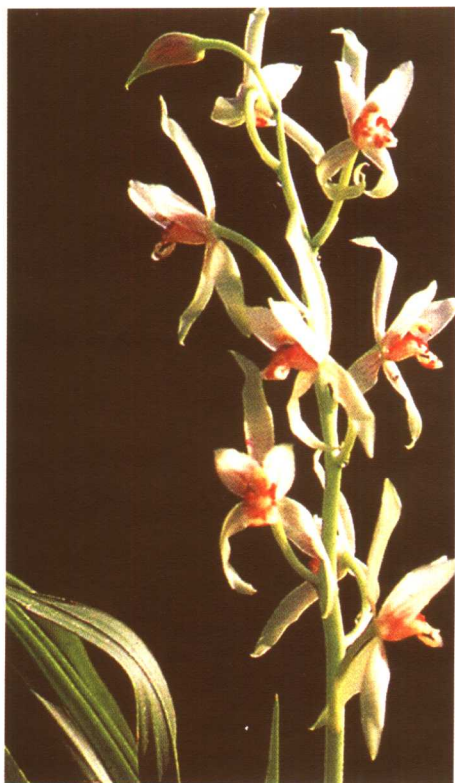
图 2-2-45 墨兰