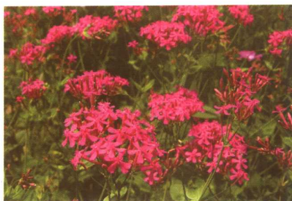
图 2-2-2 高雪轮