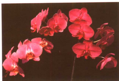
图 2-2-40 蝴蝶兰