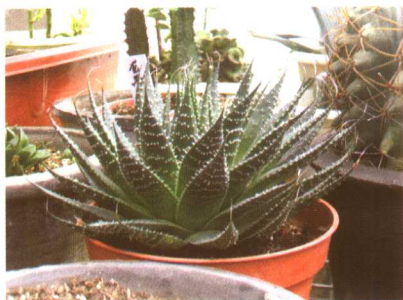
图 2-2-62 条纹十二卷