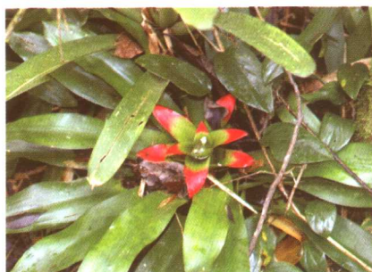
图 2-2-27 巢凤梨