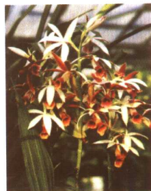
图 2-2-41 鹤顶兰