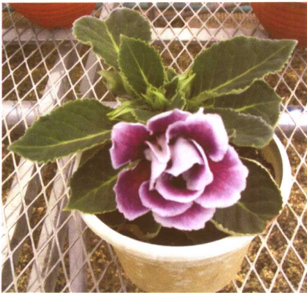
图 2-2-14 大岩桐