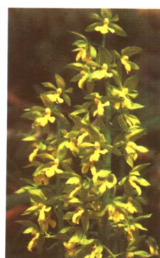
图 2-2-50 虾脊兰