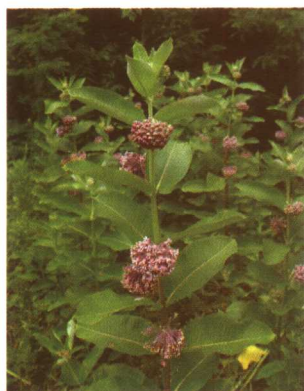
图 2-2-53 马利筋