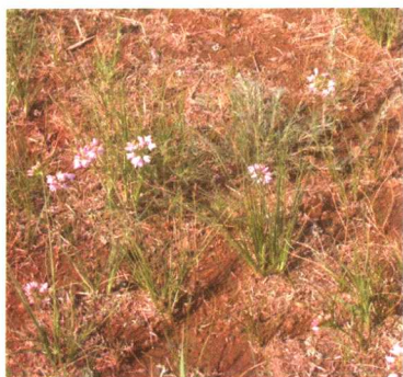
图 2-2-20 沙葱