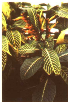
图 2-2-67 黄脉爵床