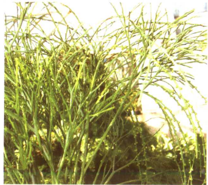
图 2-2-17 松叶蕨