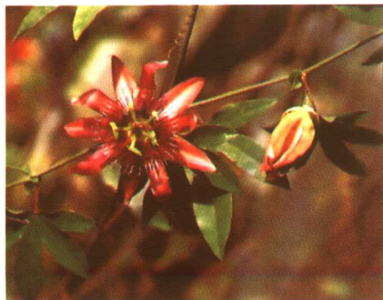
图 2-2-61 西番莲