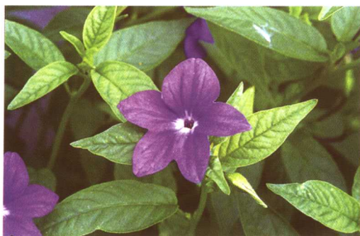
图 2-2-10 蓝英花