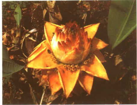
图 2-2-13 地涌金莲