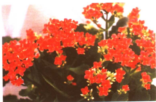
图 2-2-37 长寿花