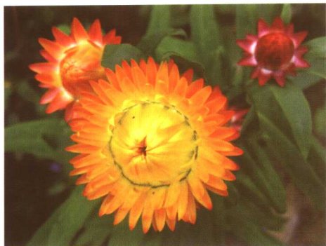
图 2-2-7 麦秆菊