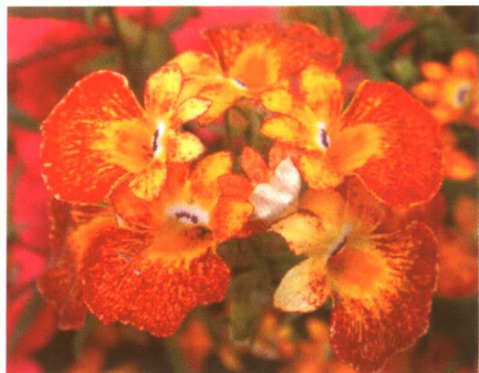
图 2-2-9 龙面花