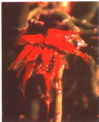
图 2-2-64 红雀珊瑚