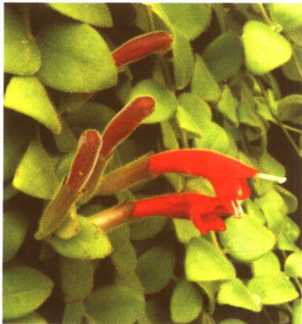
图 2-2-16 口红花