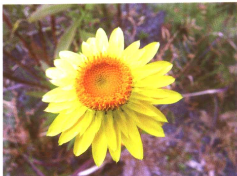
图 2-2-7a 麦秆菊