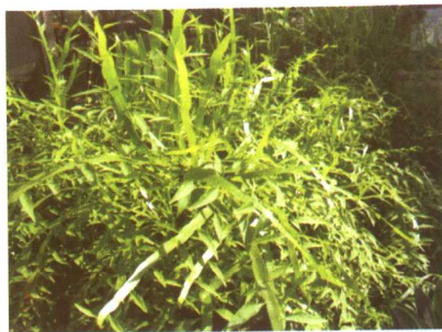
图 2-2-58 竹节蓼