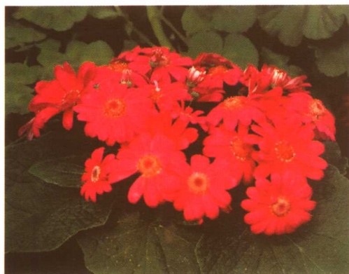
图 2-2-1 瓜叶菊