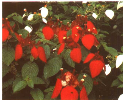
图 2-2-68 红纸扇