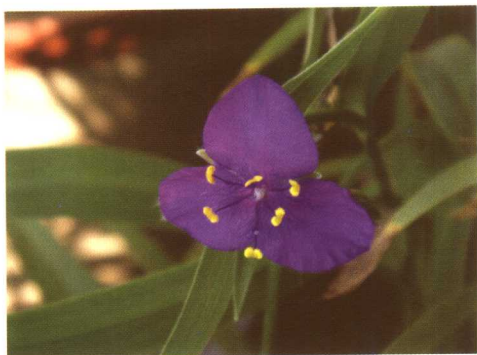
图 2-2-18 紫露草