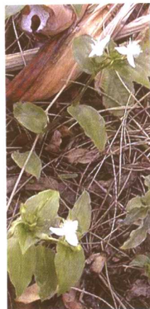
图 2-2-18a 紫露草