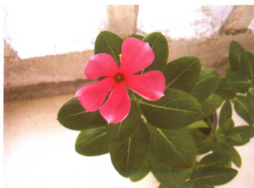
图 2-2-56 长春花