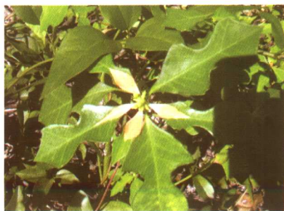
图 2-2-63 猩猩草