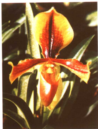
图 2-2-39 兜兰