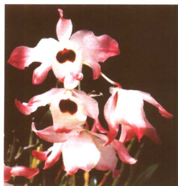
图 2-2-47 石斛兰