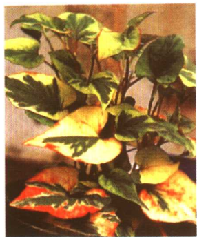
图 2-2-23 鱼腥草