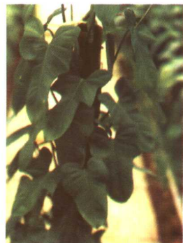
图 2-2-30 琴叶喜林芋