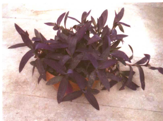
图 2-2-19 紫叶草