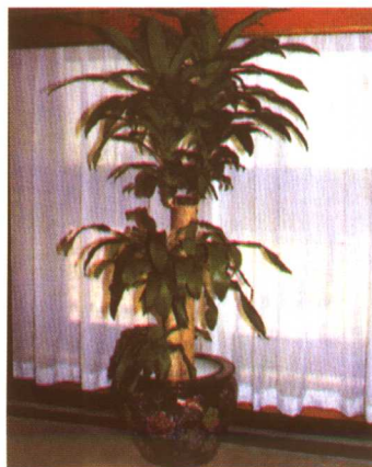
图 2-2-70 巴西木