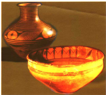
彩纹陶盆（新石器时代）