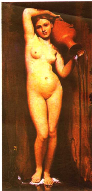
泉 (法 安格尔)