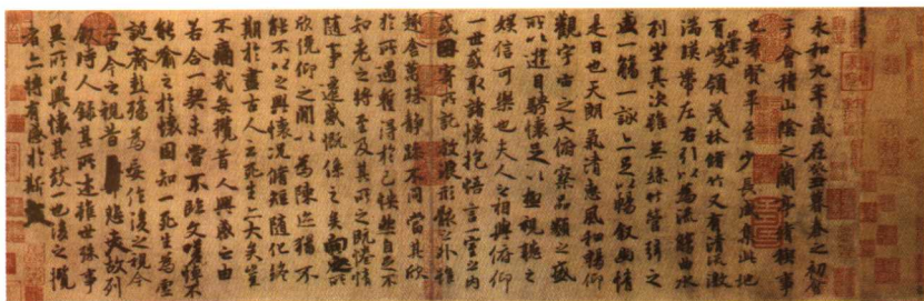
唐摹王羲之《兰亭序》