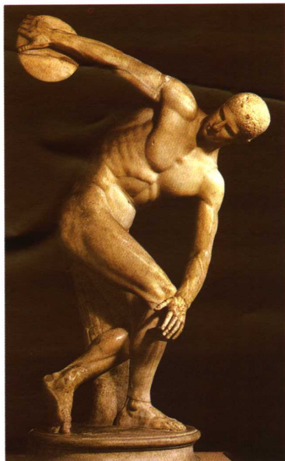
掷铁饼者 (古希腊 米隆)