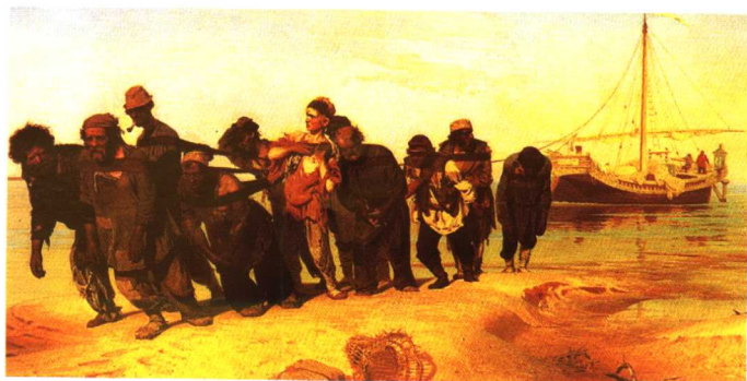
伏尔加河上纤夫(俄 列宾)