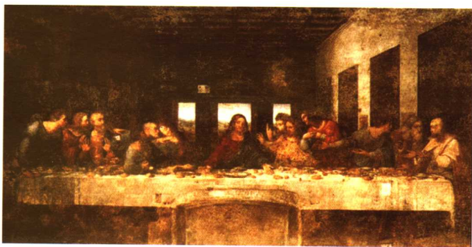
最后的晚餐(意大利 达·芬奇)