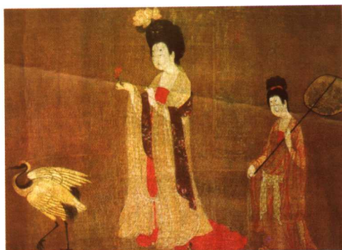
簪花仕女图 (局部 唐 周昉)