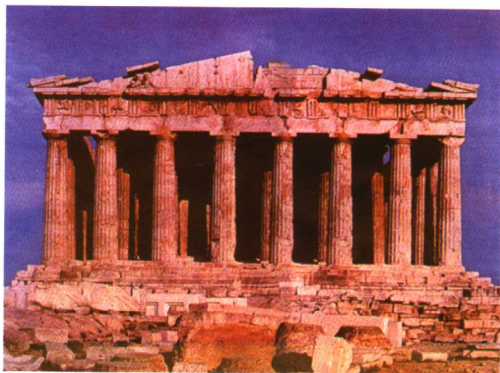
古希腊帕特农神庙