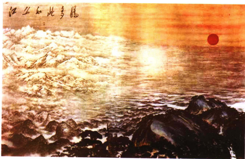
江山如此多娇(傅抱石 关山月)