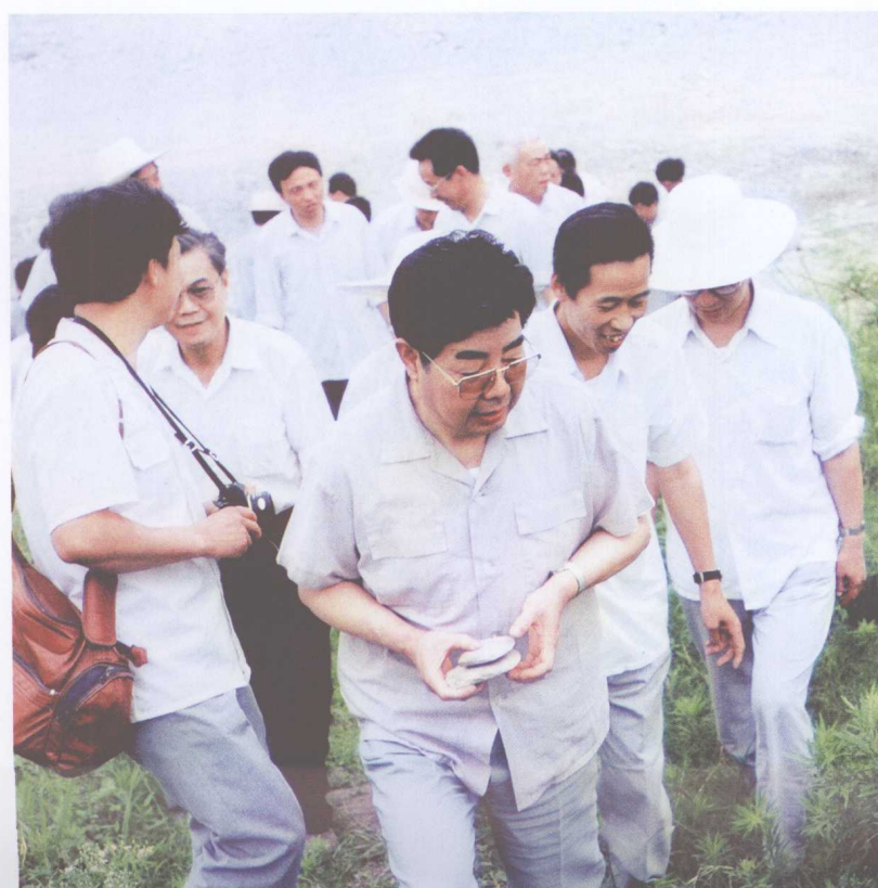
王利滨省长在遗址上考察采集石器标本时的情景

[1987年夏，湖北省副省长王利滨同志（前右）在清江隔河岩考古队总领队王善才同志（前左）等的陪同下前往古文化遗址进行考察]