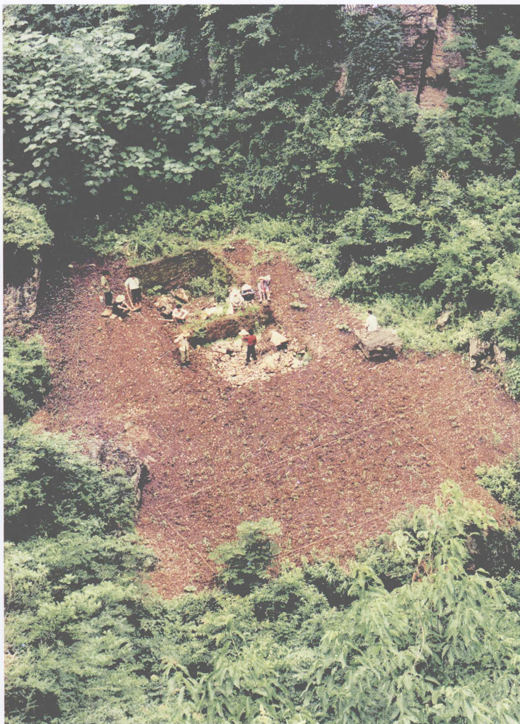
香炉石文化遗址发掘现场