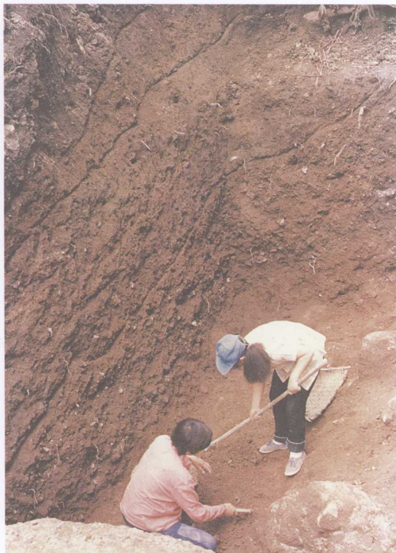
香炉石遗址发掘现场