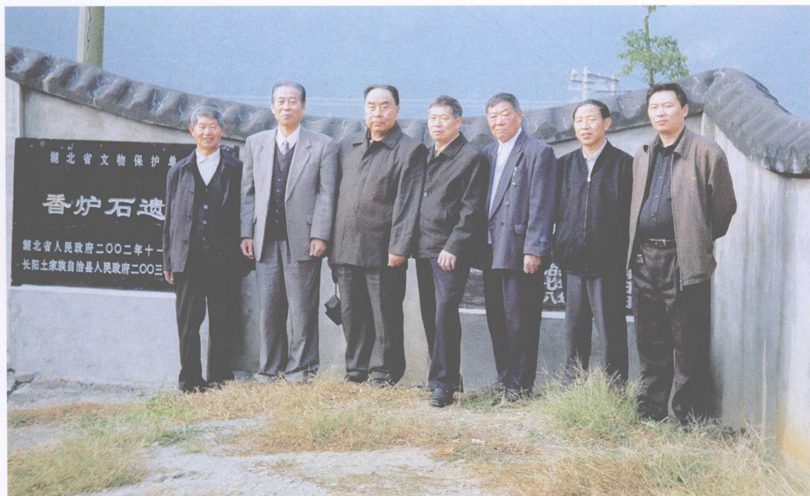
香炉石遗址保护领导小组现场研究后合影