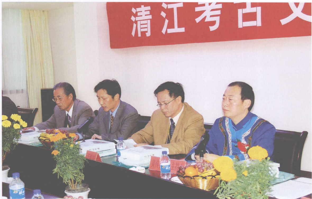
中共长阳土家族自治县县委书记在首发式大会上致词

(2004年10月18日,《清江考古》、《清江流域古动物遗存研究》、《清江考古掠影及出土文物图录》等三部清江考古文献首发式大会在鄂西清江长阳隆重举行)