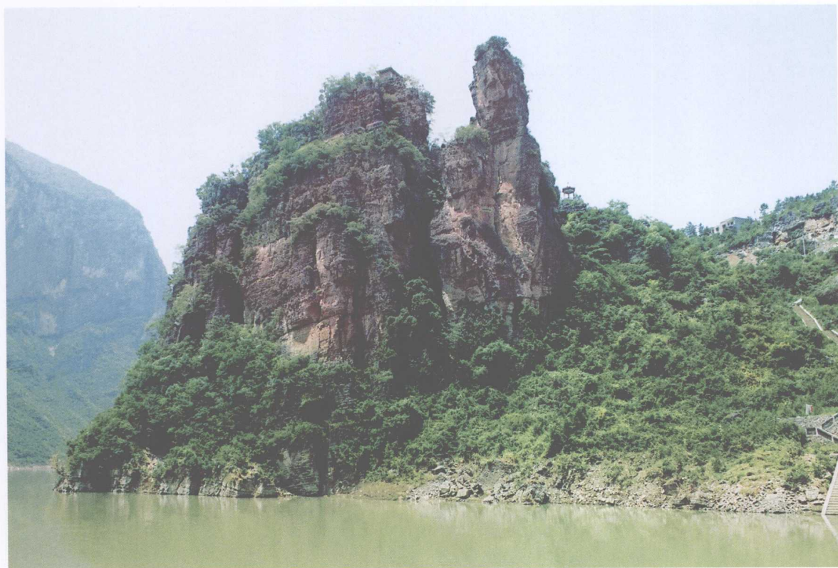
中国早期巴人的典型遗址——香炉石遗址地貌