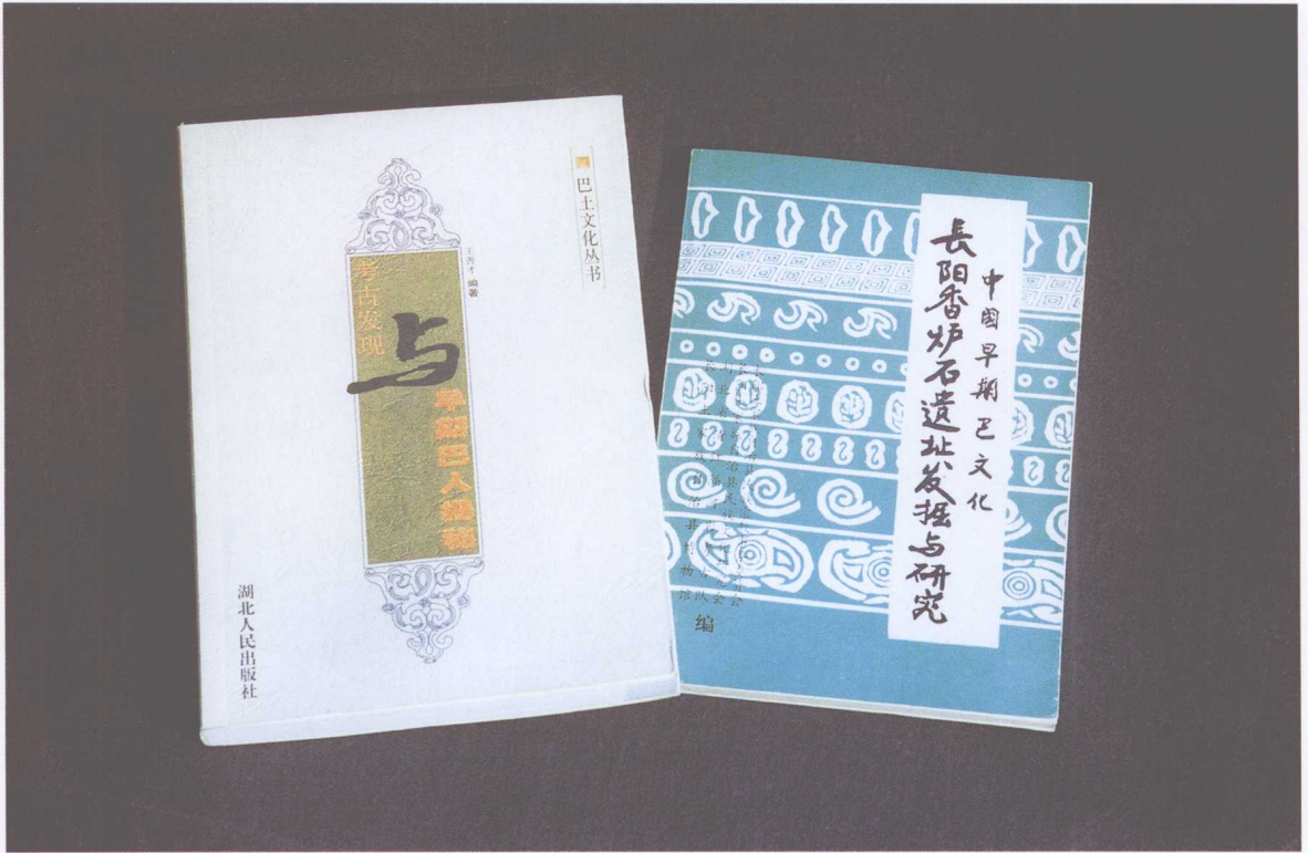
本书作者先前主编和编著的《中国早期巴文化——长阳香炉石遗址发掘与研究》和《考古发现与早期巴人揭秘》两部书