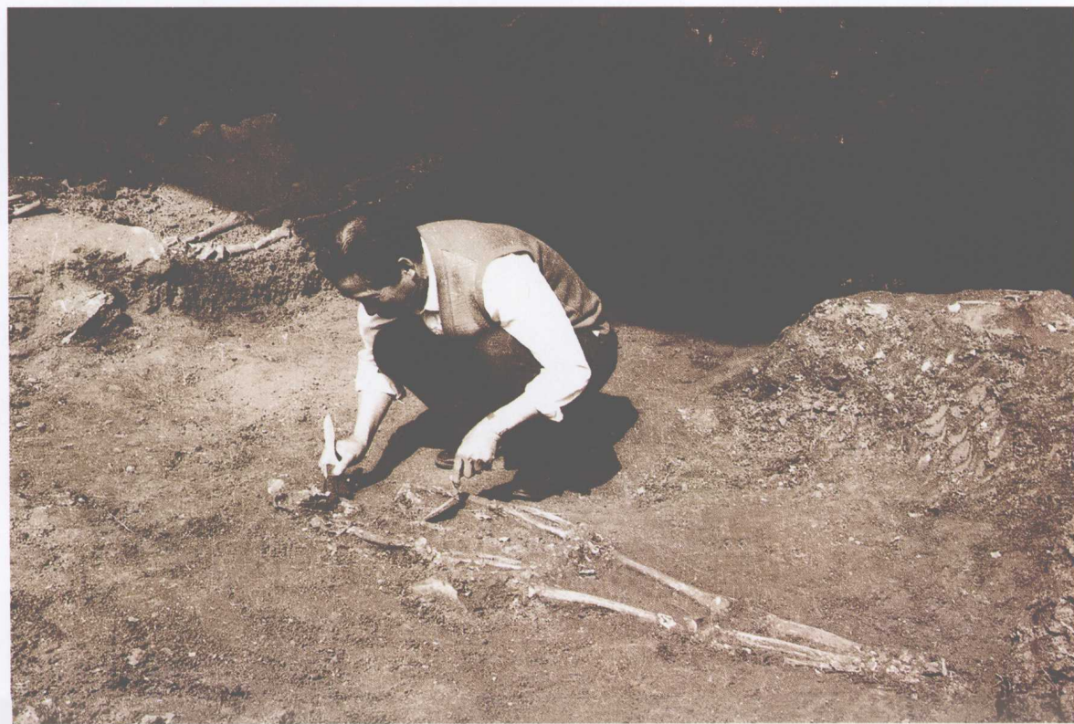
香炉石遗址早期巴人崖葬墓地发掘一景 (本书作者在清理崖葬墓出土的巴人人骨)