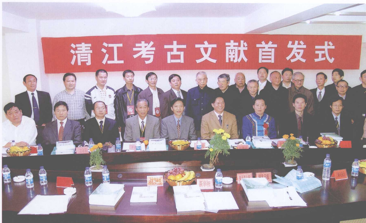
清江考古文献首发式大会会场

(2004年10月18日,《清江考古》、《清江流域古动物遗存研究》、《清江考古掠影及出土文物图录》等三部清江考古文献首发式大会在鄂西清江长阳隆重举行)