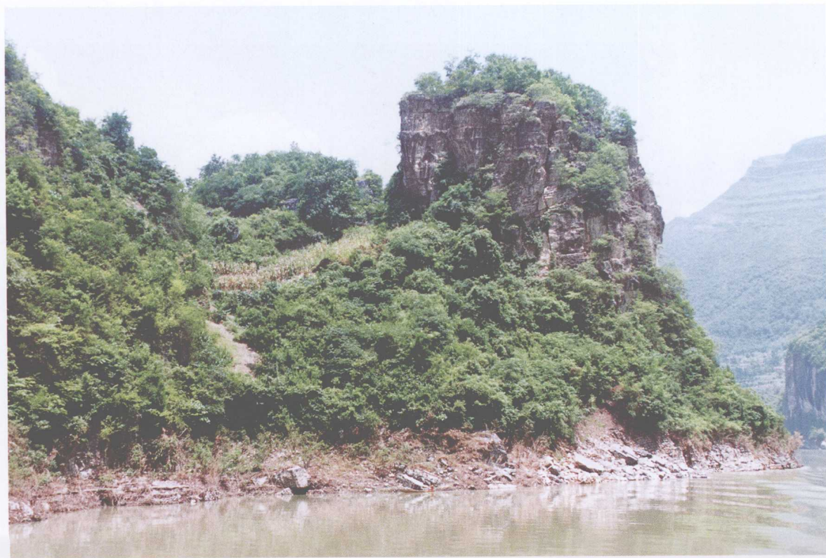
香炉石遗址西南面地貌