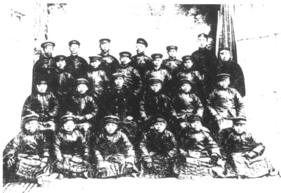
1907年2月，荷属东印度（现印度尼西亚）爪哇岛第一批24名侨生抵达南京。