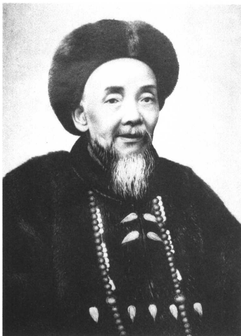
陈伯陶（1855—1930），广东东莞人，参与筹办暨南学堂的清朝江宁提学使。暨南学堂校名由他拟定。“暨南”二字源自《尚书·禹贡》：“东渐于海，西被于流沙，朔南暨，声教讫于四海。”意思是将中华文化传播到五洲四海。