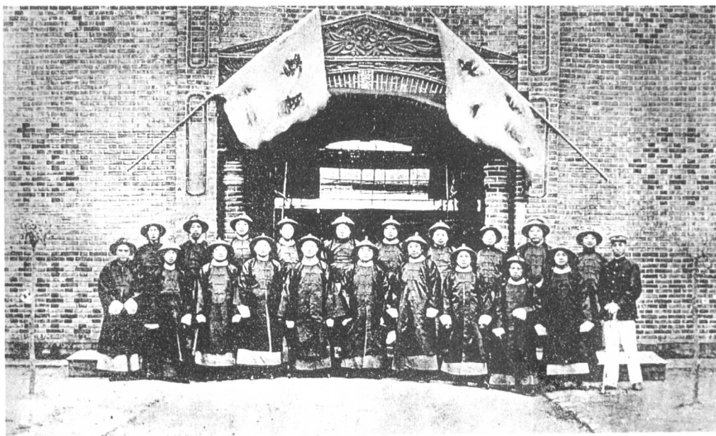
1909年（清宣统元年）暨南学堂教职员合影于南京暨南学堂校门