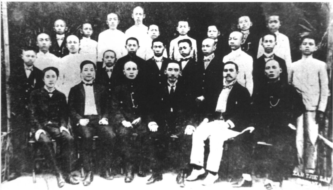
1907年初，第一批回国就读的荷属东印度（现印度尼西亚）爪哇岛侨生，在离开爪哇岛时的合影。