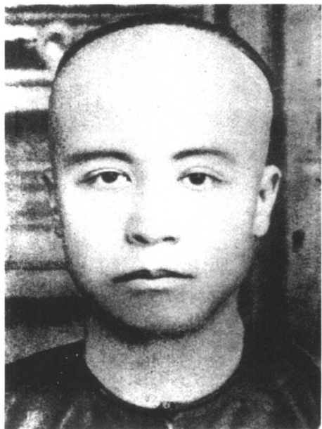
郑洪年（1876—1958），广东番禺人。华侨教育家。1906年参与筹办暨南学堂，并任第一任堂长（任期：1907—1909年）。