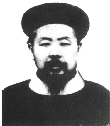
端方 (1861—1911)，满洲正白旗人。历任清朝两江总督、直隶总督等职。