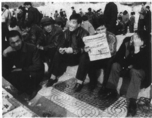
大量的农民工在劳务市场等待雇主*