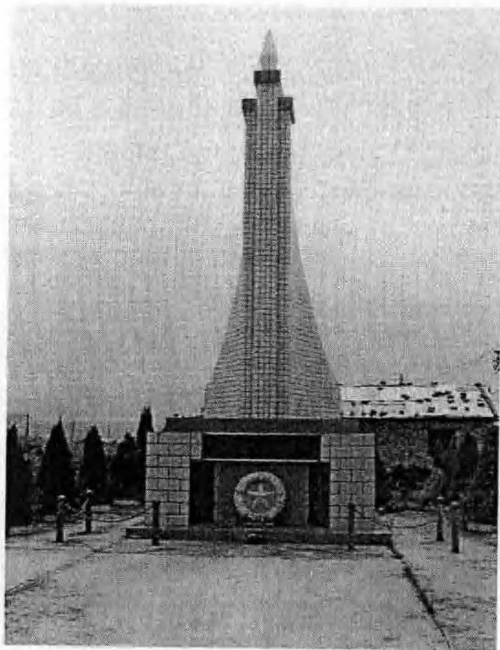
百谷红军烈士纪念碑