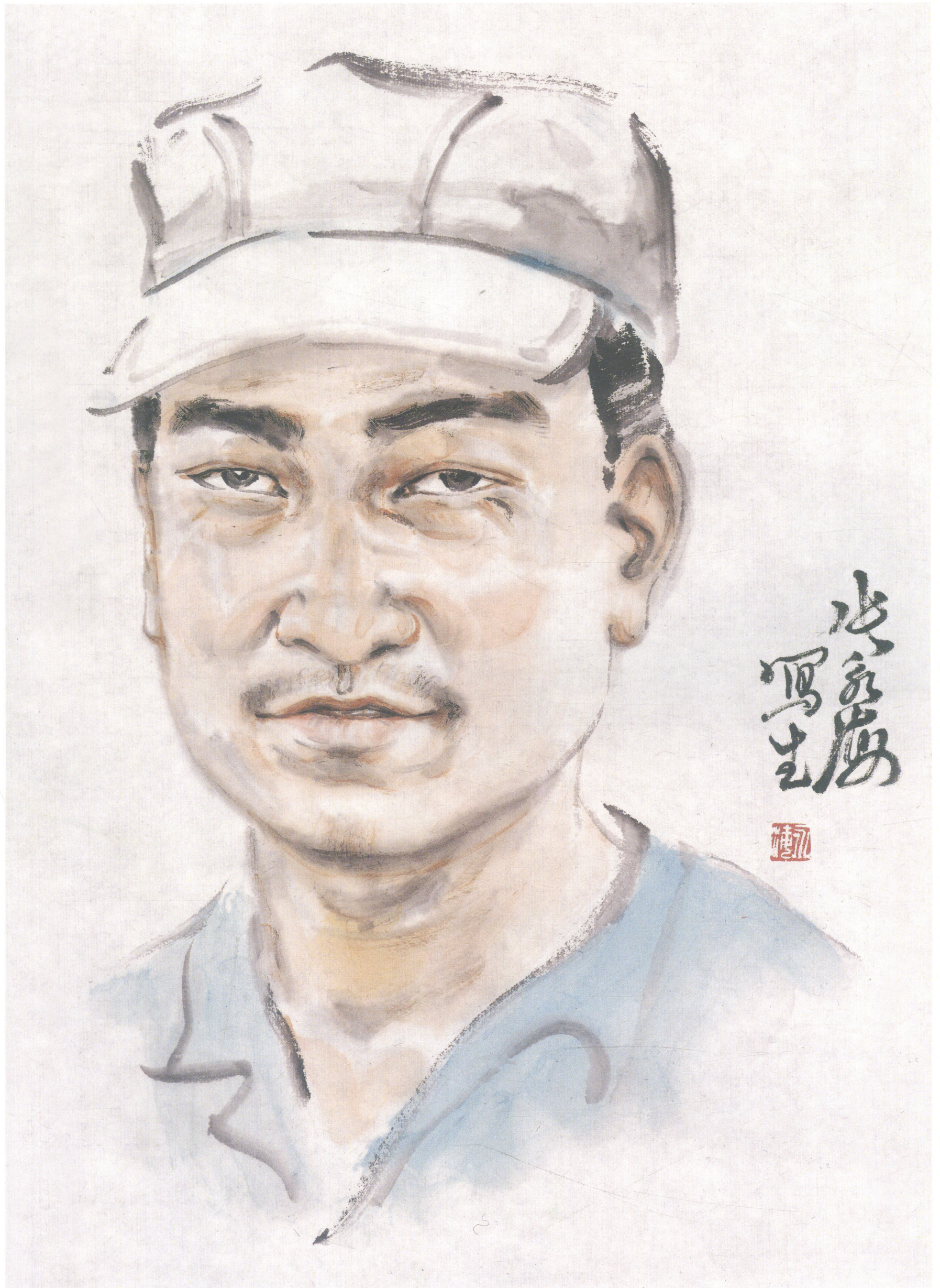
渔民 35×46.5 cm

头像写生既有利于形象的积累，又能培养敏锐的审美感受力。人的面部表情是非常丰富的，人的心理活动也主要依靠表情传递出来。同时，由于性别、年龄、职业、遗传等的不同，人物形象的外部特征也各异。人物性格神情是通过整体的表现而传达出来的。但五官必须是重点，尤其是眼睛。顾恺之说：“传神写照，正在阿睹之中”。眼睛是人的心灵之窗，能否使形象传神，眼睛的刻画极为重要。在写生中要体悟那种微妙的感觉并予以捕捉和表达。