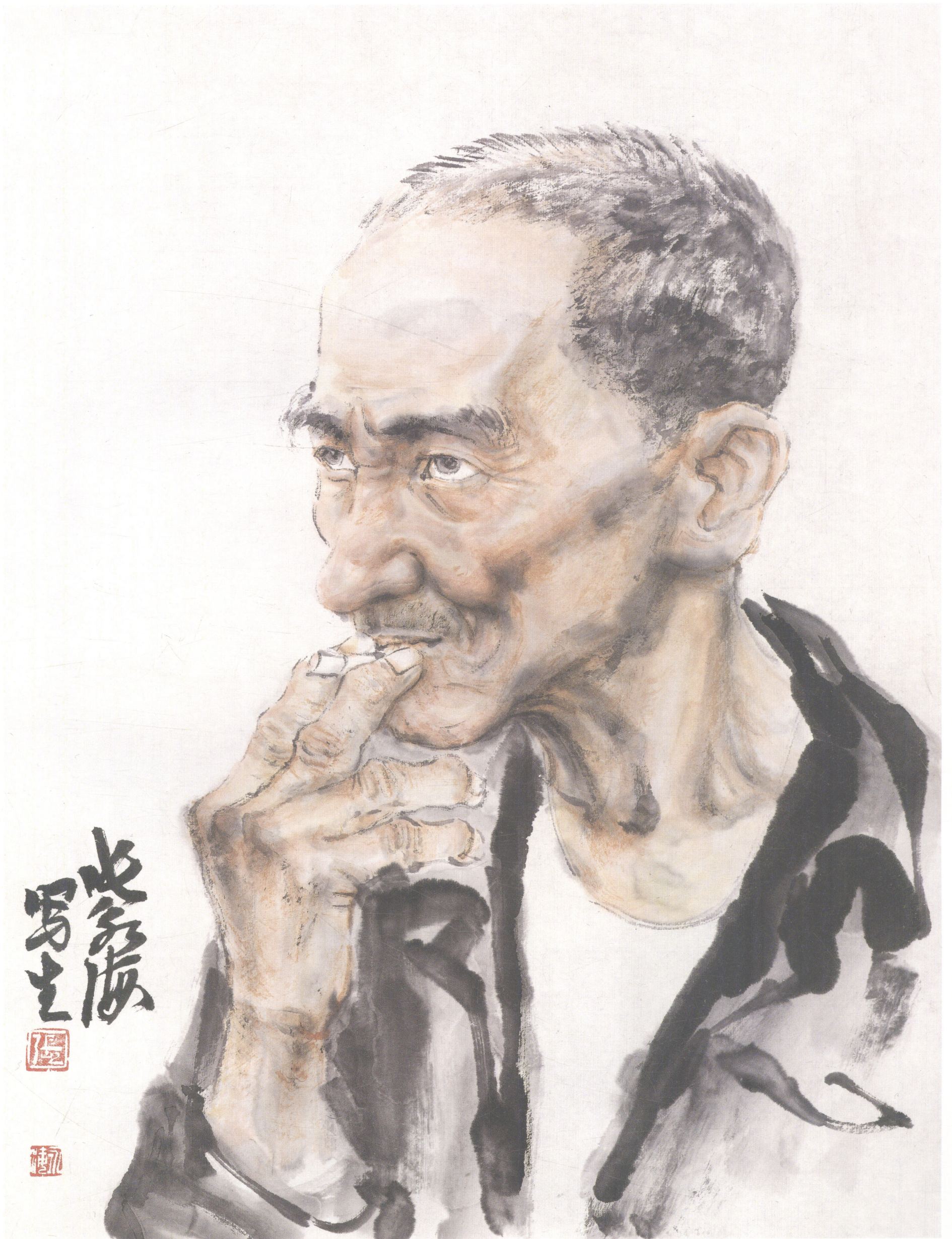
吸烟的老农 35×46.5 cm

要善于抓住人物的一些动作和表情进行写生，它将使形象变得更加生动有趣起来。这位老人正独自在角落里抽烟，神情安详，但若有所思，似乎心里正盘算着什么，深邃的眼睛眺望着远方。他是在注视着那头吃草的耕牛？还是在酝酿明年春天的播种？是在路口等待孙儿的放学回家？还是在盼望金秋时节的喜悦丰收？在那沧桑的脸上和粗糙的手指间，可以看出他一生的辛劳，但内心依然保持对生活的向往和美好的期盼。面对这饱经风霜的老人，不需要夸张和华丽的笔墨，真诚地去面对，朴实的语言更能表达出朴实的灵魂。