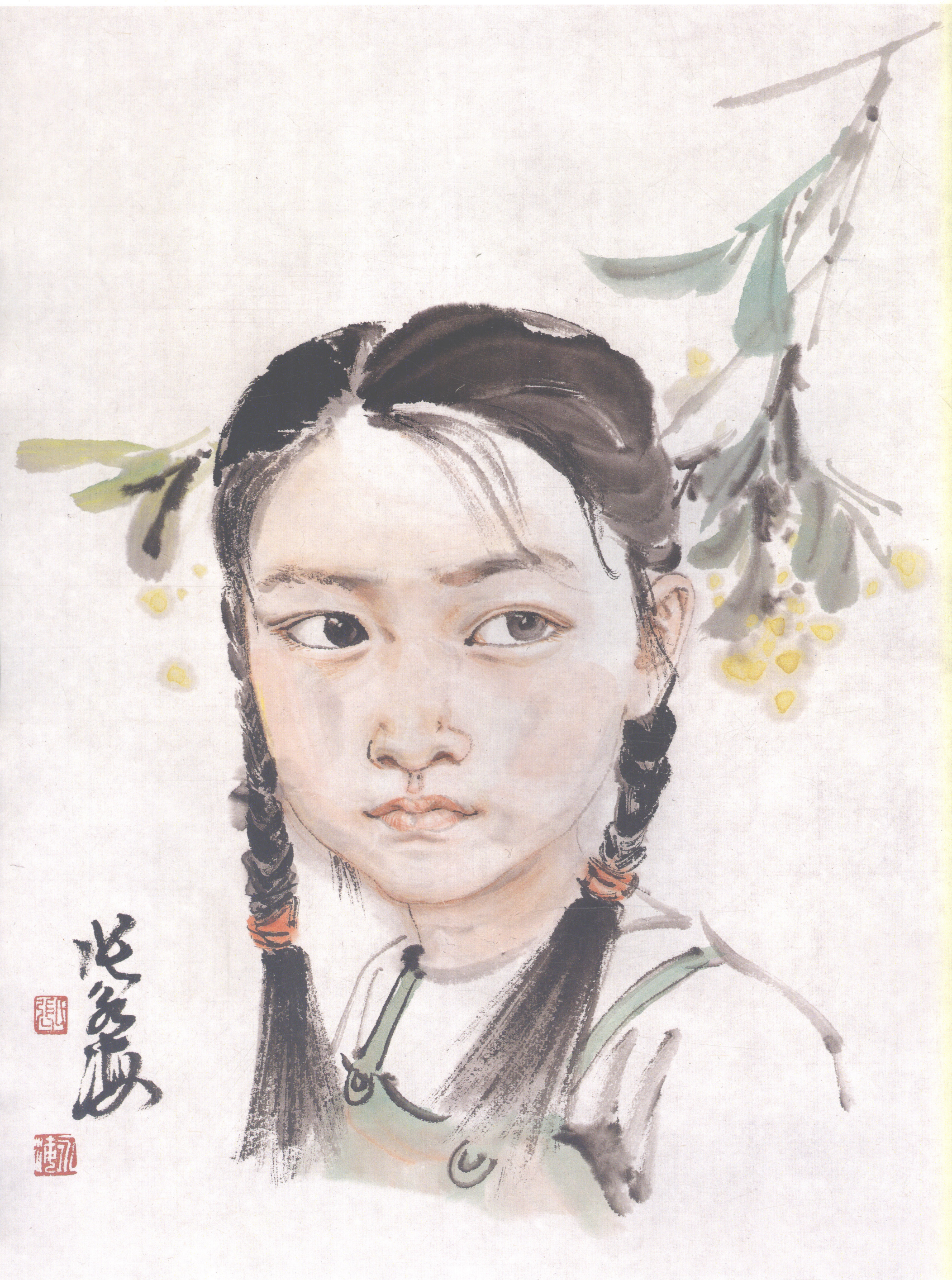
小茗茗 35 × 46.5 cm