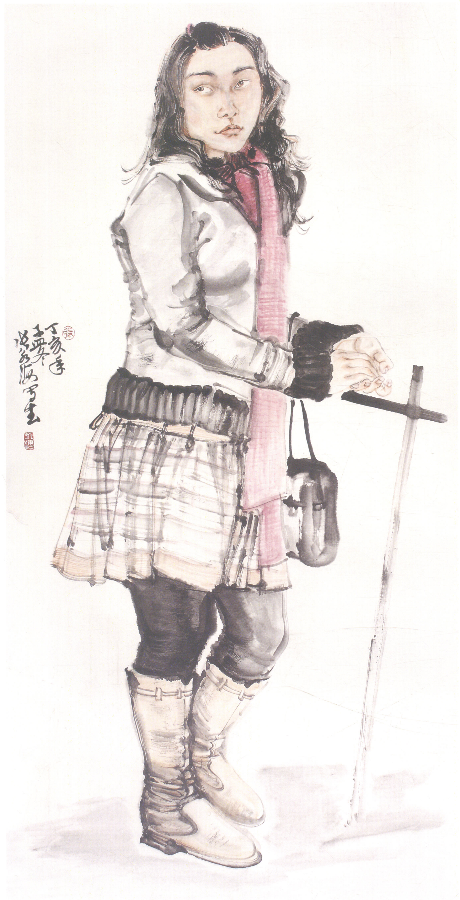
独自等待 68 x 138 cm