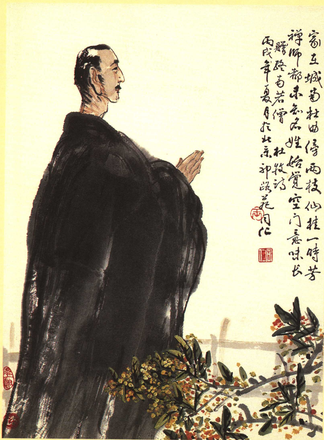
贈終南蘭若僧 詩意圖 王同仁 繪