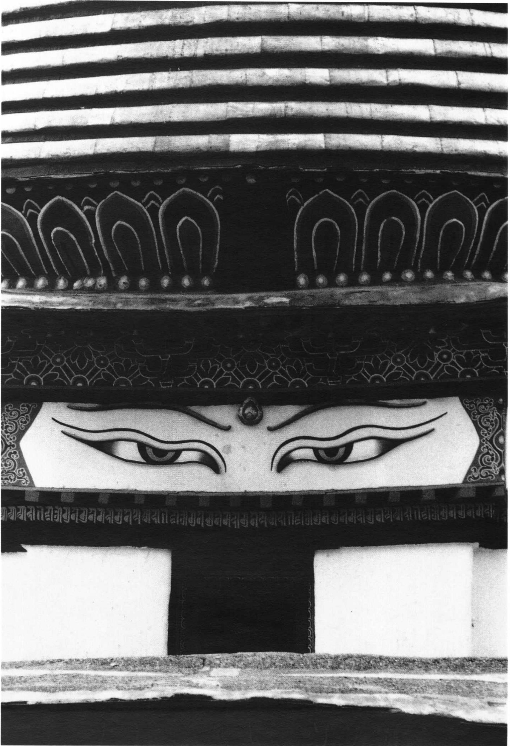
江孜縣 江孜鎮 白居寺