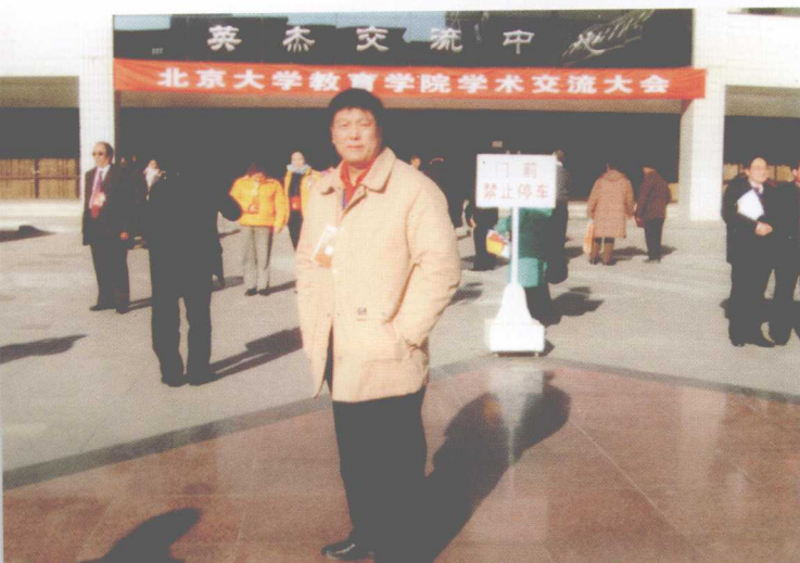
◀ 参加北京大学教 育学院学术交 流大会