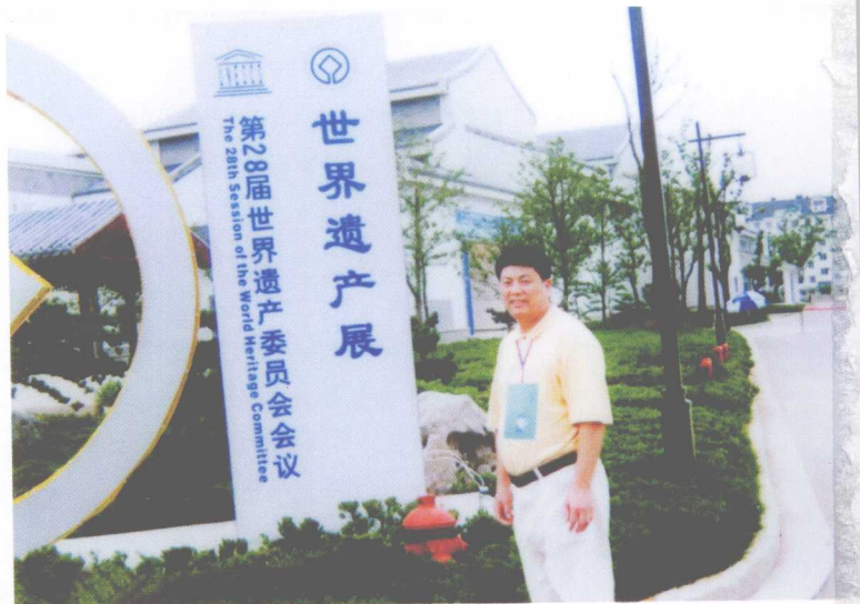
▶ 参加第 28 届 世界遗产委员 会会议