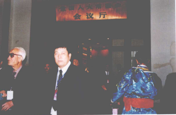
◀ 在全国人大常 委会会议厅前