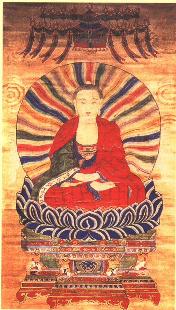
清 · 彩绘佛像