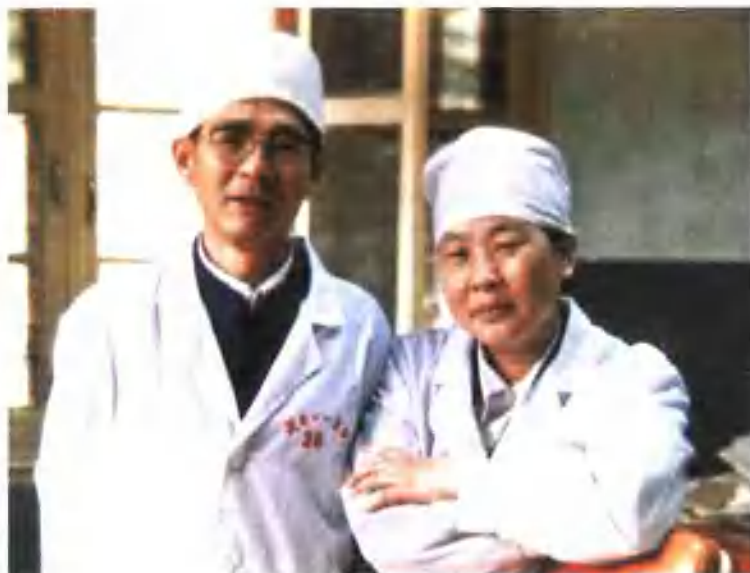
作者与夫人开彩玲合影