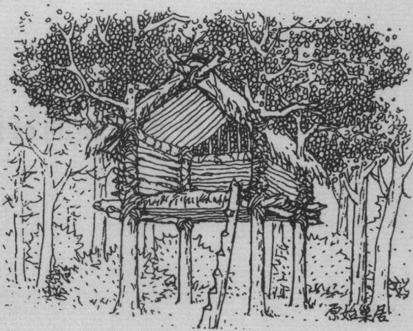
图 1-1 原始巢居——利用树木搭建架空的窝棚

文字是语言的书面符号，所以提到语言，一定离不开文字。不仅汉字构成的语句、文章与文化密切相关，单个的汉字也能够独立地承载文化信息。在汉字演进的过程中，绝大多数汉字都保留了表意性特点。象形是中国文字发生的主流，即便今天所使用的楷书汉字，许多还是能够显示出它象形图案的蜕变痕迹。通过汉字的表