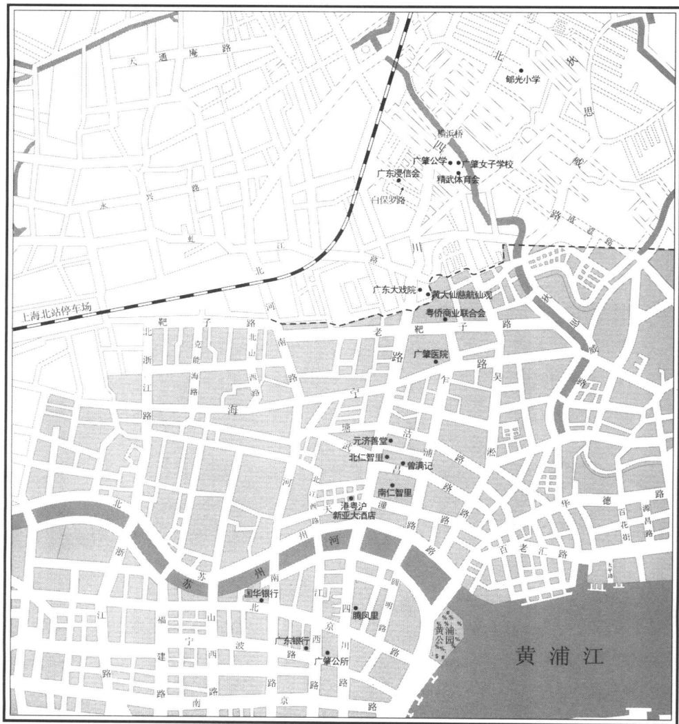
图例 · 广东人活动中心