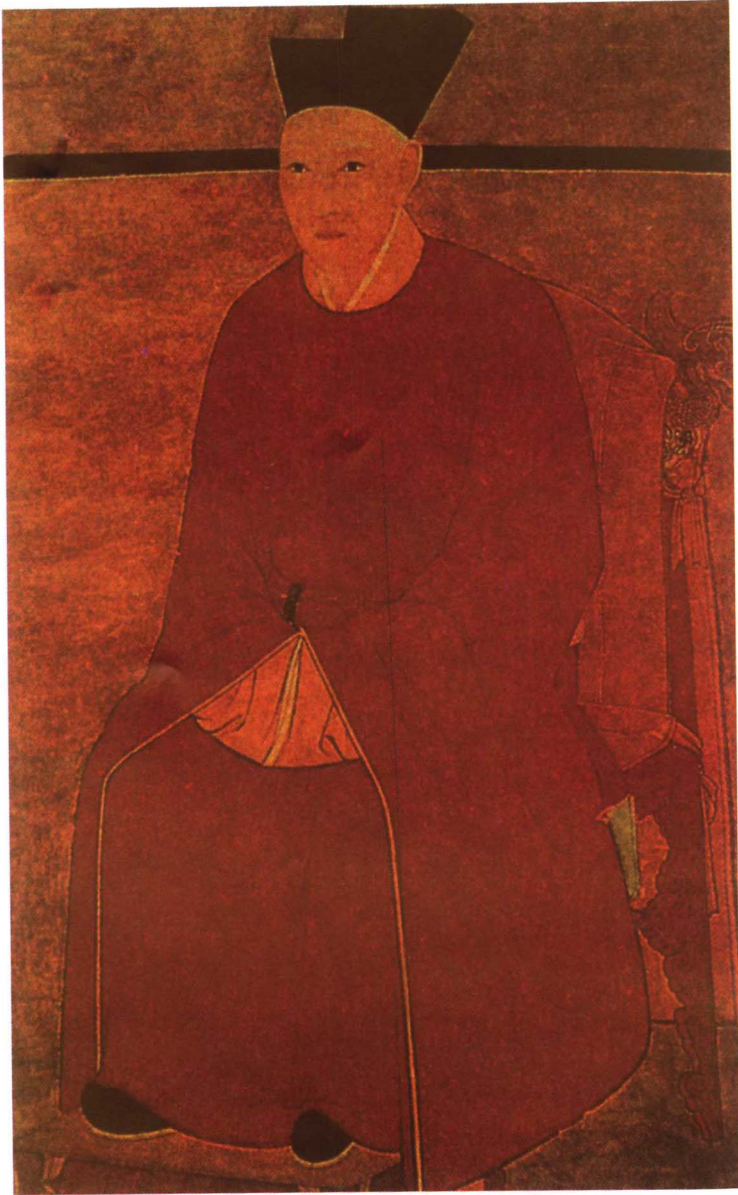
宋高祖 赵 构