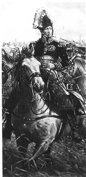
战场上的内伊元帅 若米尼在法军的恩人和靠山— 大军第6军军长内伊元帅