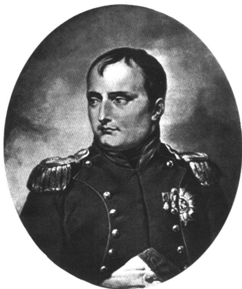
授予若米尼法军上校和准将军衔 的“战争之神” 法皇拿破仑一世（韦尔内画）