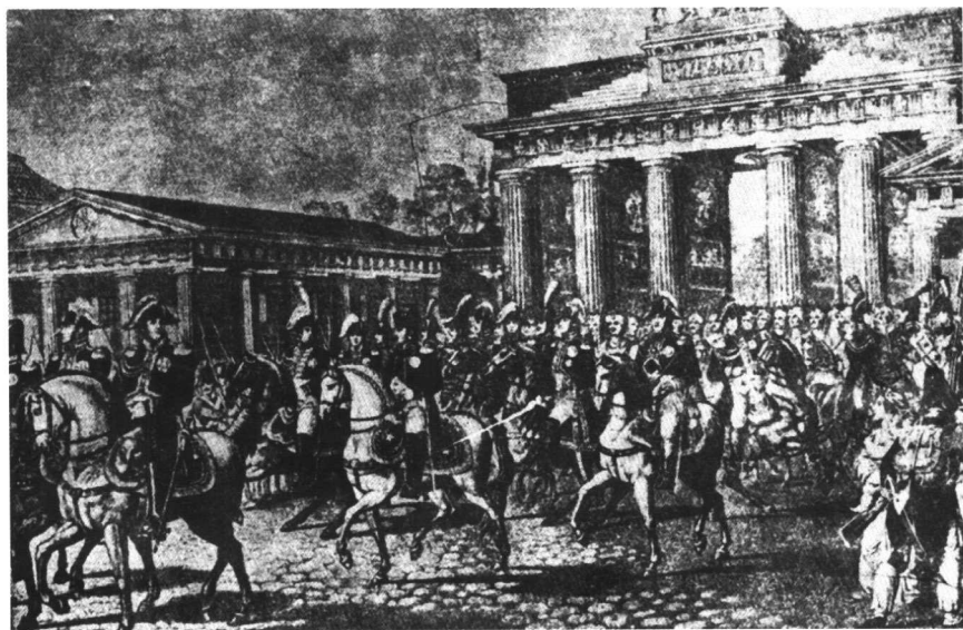
1806年耶拿会战后若米尼随法皇拿破仑进入柏林