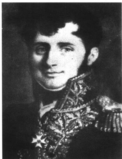
若米尼将军在俄国 (米纳雷画)