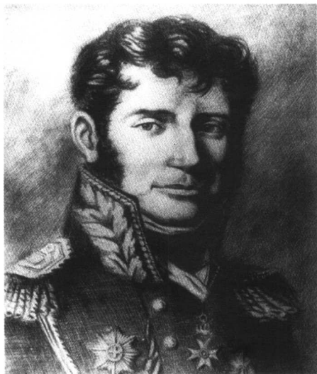
若米尼在俄国后期 (刘晓明画)