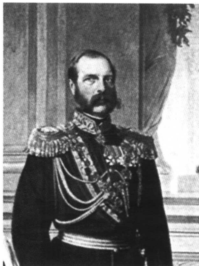
授予若米尼俄军最高军衔—步兵上将的 俄皇尼古拉一世