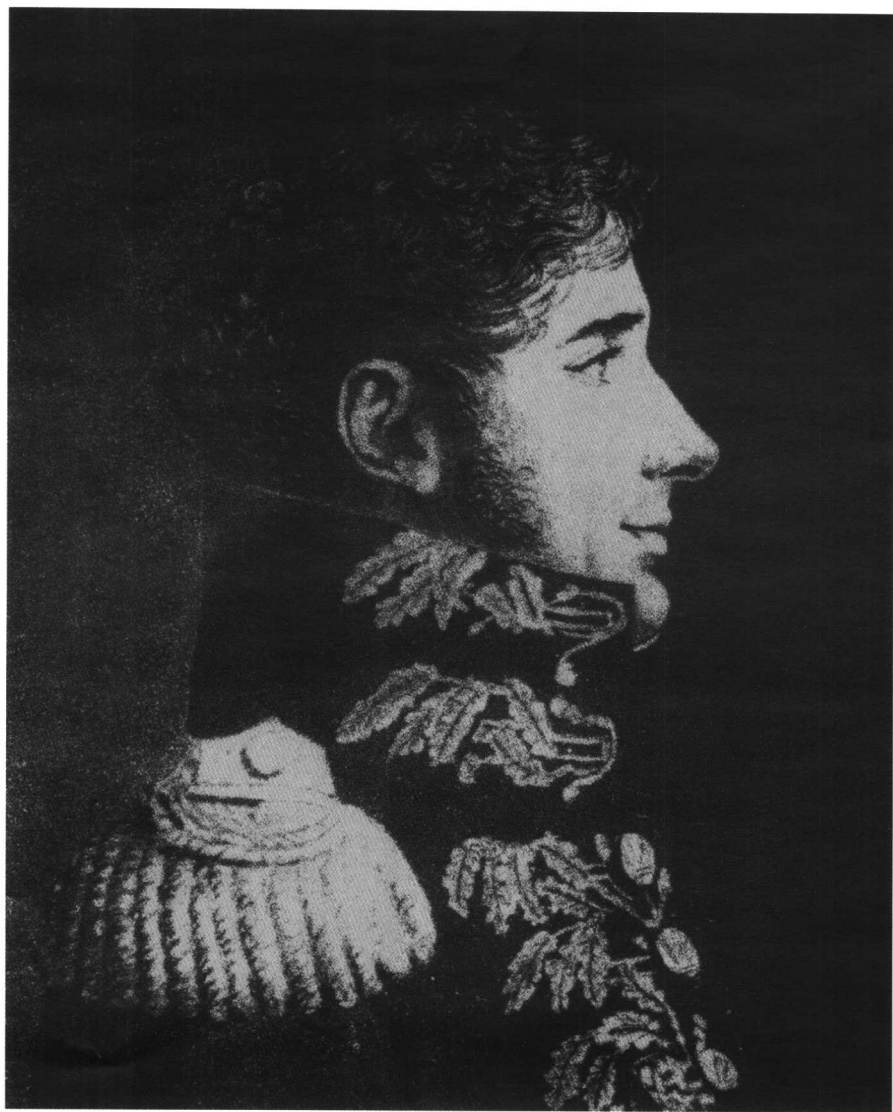
法军第6军参谋长若米尼上校 (恺内代画刻)