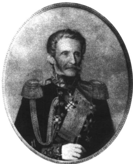
若米尼将军后期肖像 (格莱夫乐画)