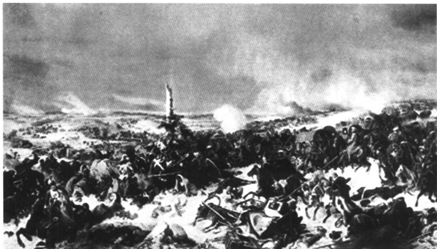
1812年11月，若米尼随法军撤离俄国途中险些丧生其中的别列津纳河渡河之战 (埃斯画)