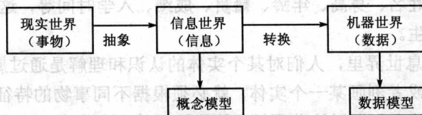
图 1-1 3 个世界之间的对应关系

对信息社会而言, 事物、信息、数据分别对应着现实世界、信息世界和机器世界, 它们之间的对应关系如图1-1所示。