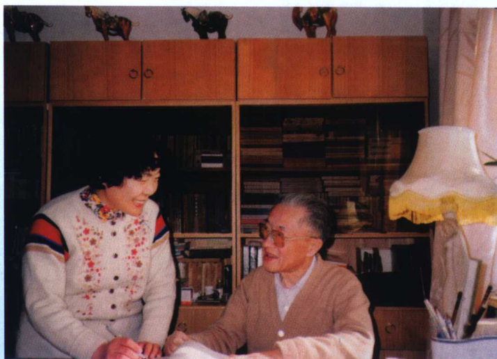
一起工作是生活中的第一快事