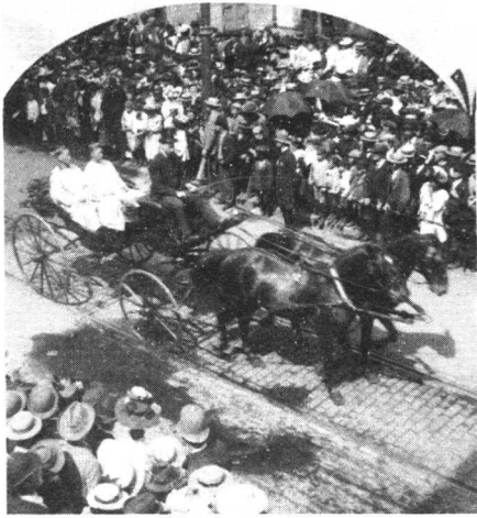
① 李鸿章访问美国费城。