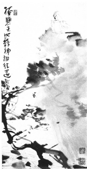
独应于无人之野 (2007年)