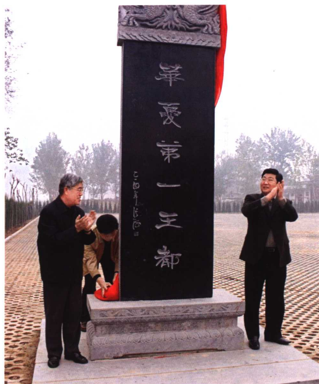
“华夏第一王都”碑揭幕