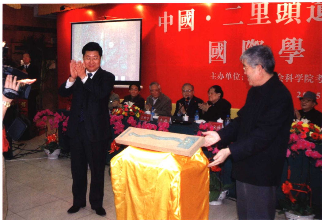
“中国龙”复制品展示