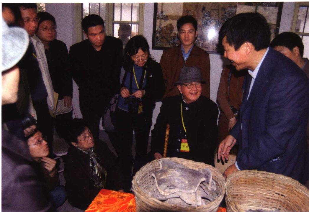
会议代表参观二里头工作队