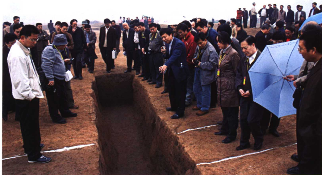
与会代表参观二里头遗址考古现场