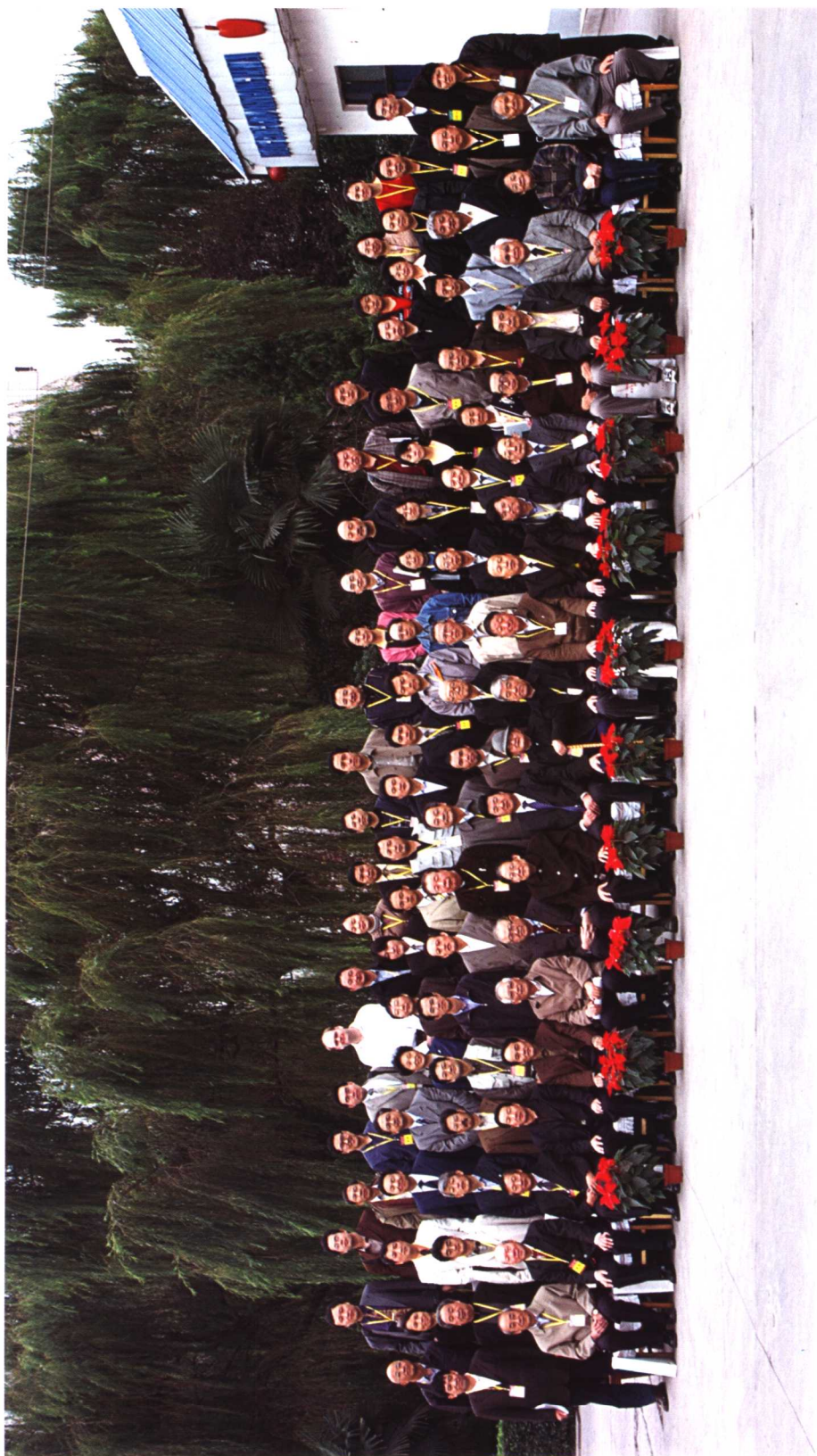
中国·二里头遗址与二里头文化国际学术研讨会与会代表合影