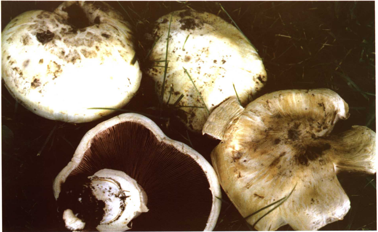
图-1A 蘑菇 ( Agaricus campestris ) 的子实体