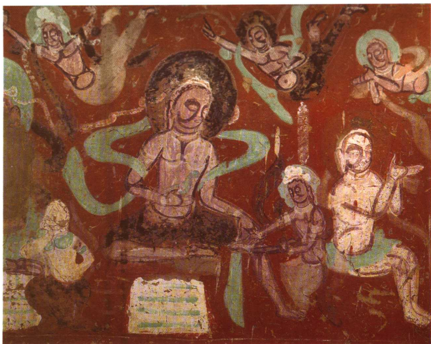
尸毗王救鸽故事。敦煌莫高窟257窟。北凉时代。局部。尸毗王盘坐，刀手割取王肉；右面有人提秤，准备称量尸毗王肉与鸽。