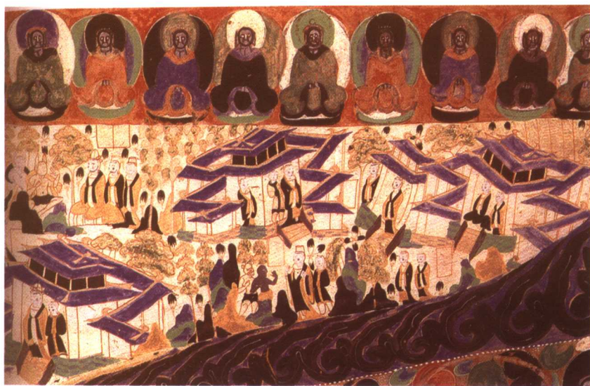
太子迦良那伽梨故事。敦煌莫高窟296窟。北周时代。局部。迦良那伽梨太子入海。