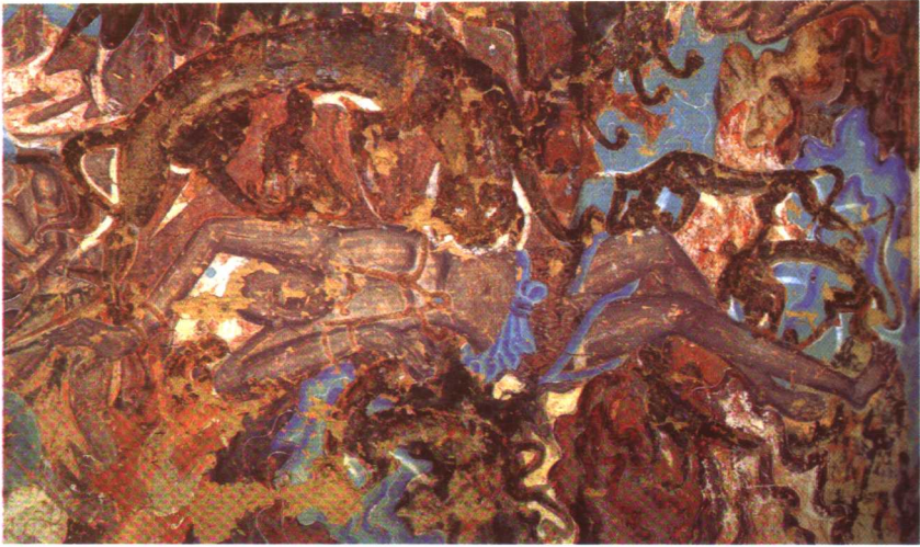
王子摩訶薩捶故事。敦煌莫高窟254窟。北魏時代。母虎及虎仔撲在薩捶身上咬食其肉。