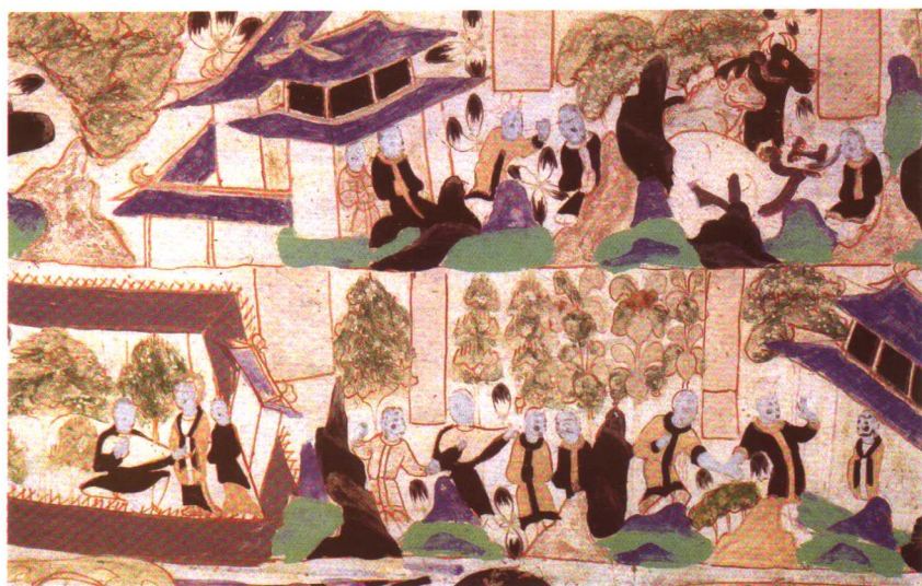
太子迦良那伽梨故事。敦煌莫高窟296窟。北周时代。局部。迦良那伽梨太子流落利师跋陀国。