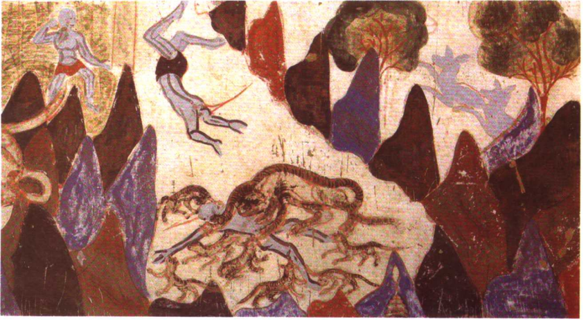
王子摩訶薩捶故事。敦煌莫高窟428窟。北周時代。局部。薩捶太子投身餵虎。