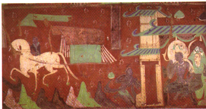
九色鹿故事。敦煌莫高窟257窟。北魏时代。局部。九色鹿救落水人，落水人叩谢九色鹿。