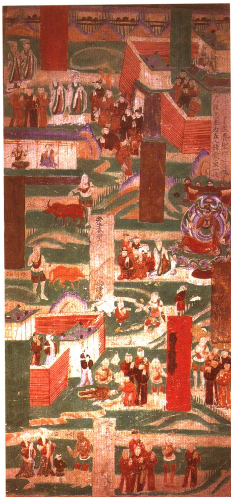
檀膩鞞故事。敦煌莫高窟98窟。五代。全图，故事依次排列。