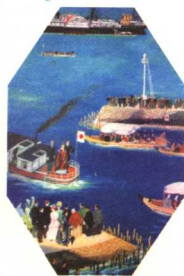
走向世界 山口蓬春