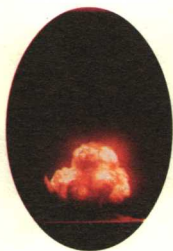
令人惊悚的蘑菇云