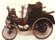
1897 年生产的奔驰牌汽车