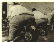
抗高压的日本摩托车