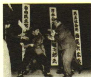
刀剑下的政治 长尾安 1960年