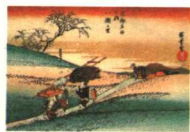
面临新的改革 歌川广重