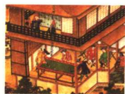
17世纪荷兰商人 居住的出岛