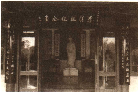
▲ 济南李清照纪念馆

位于山东济南趵突泉公园内柳絮泉旁。始建于1959年，1980年重建。仿古典格局，内有彩壁、正厅、叠翠轩、溪亭等。彩壁上铸“一代词人”4字，门内为李清照仿铜塑像，室内陈列李清照画像、生平事迹资料及各种版本的著作。