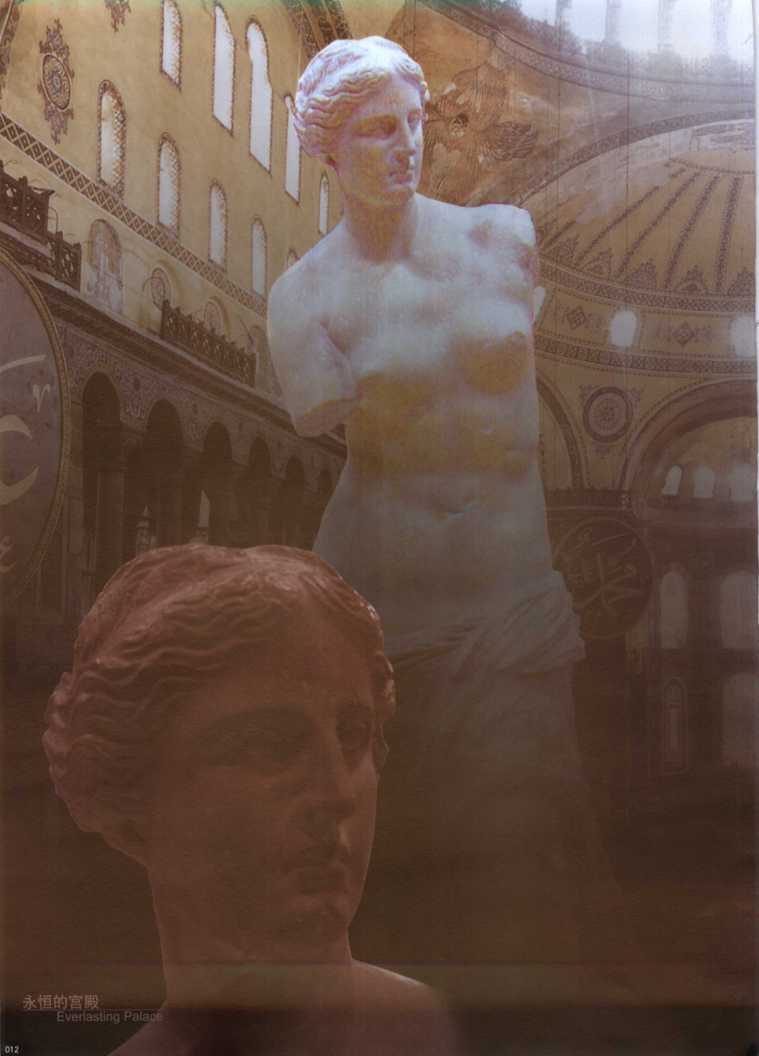
永恒的宫殿 Everlasting Palace