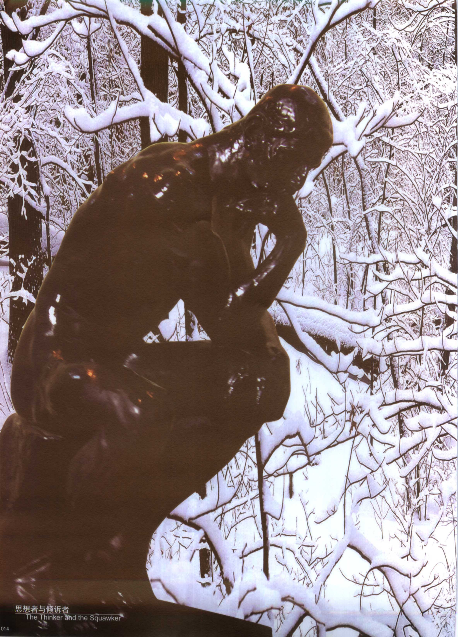
思想者与倾诉者 The Thinker and the Squawker