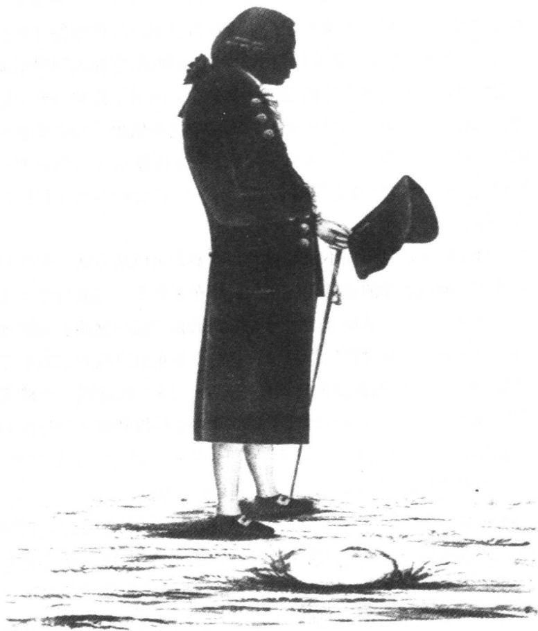
插图 1：康德。1798 年普特里希作画

界限。因此谁要是在康德那里只看到一种新的形而上学的起源，那么他的理解就像那些沿袭门德尔松仅仅把康德视为彻底摧毁形而上学者的人的理解一样。