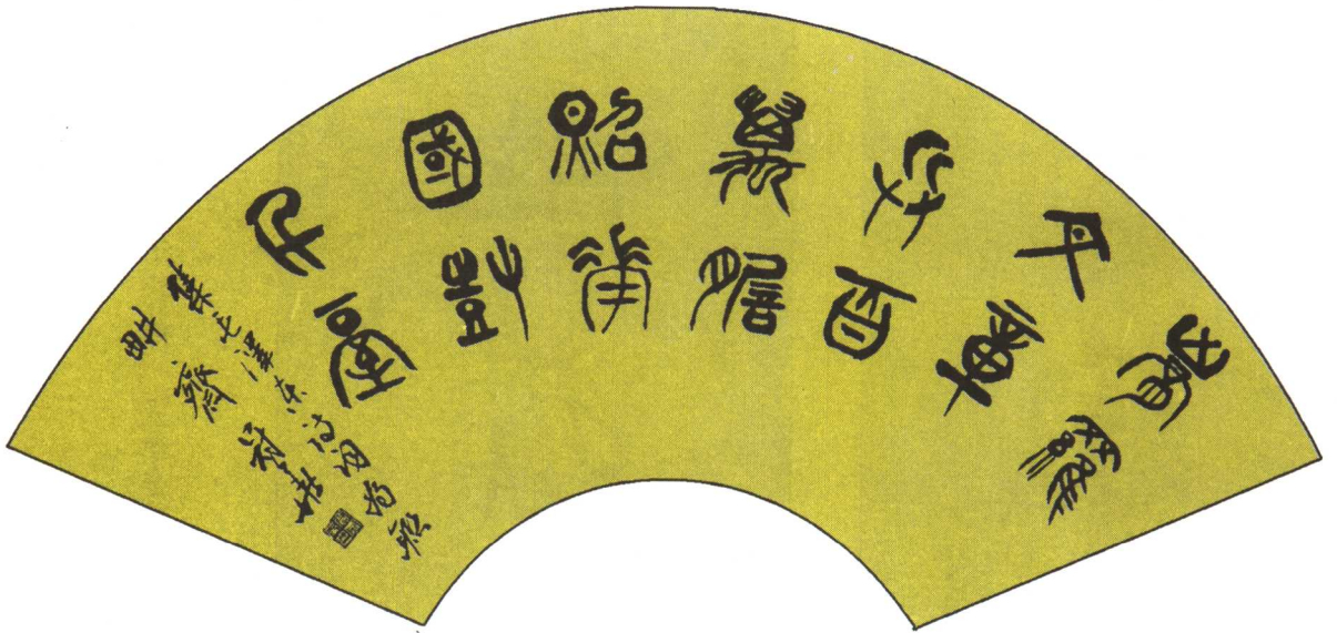
胸罗文章兵百万；胆照华国树千台。 此联出自《七律·咏贾谊》第三四句。