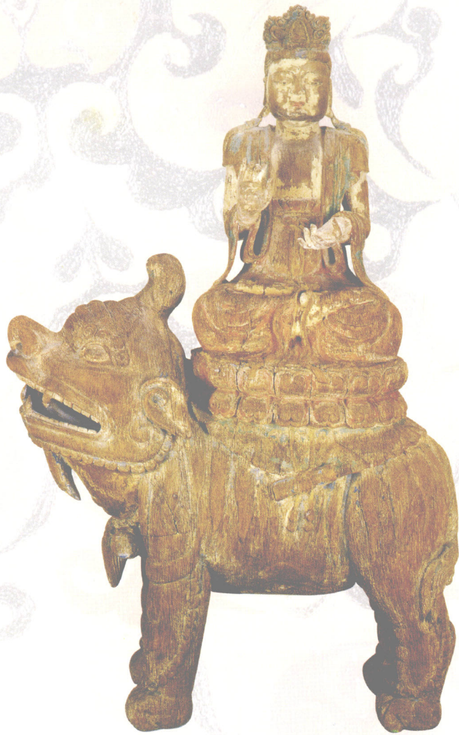
木雕彩绘观音骑狻像（宋）