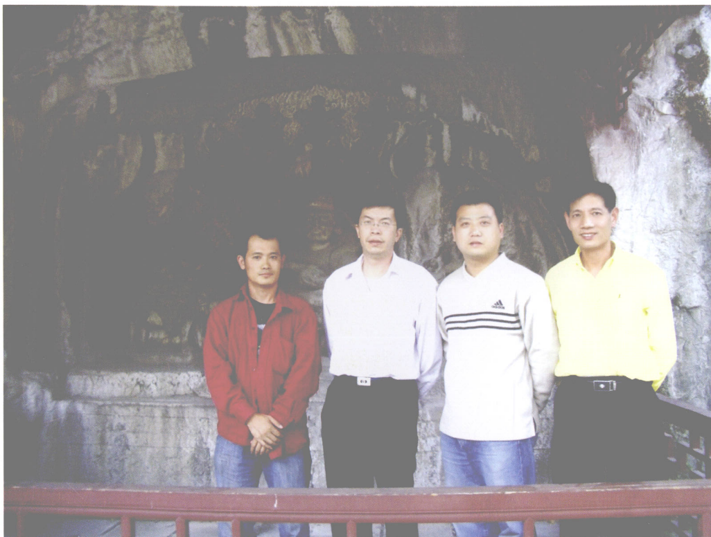
(2004年秋摄于杭州吴山宝成寺)