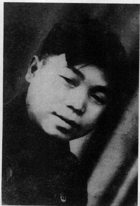
中学毕业后在家乡小学任教