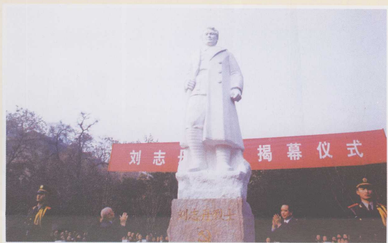
2005年刘志丹雕像揭幕仪式