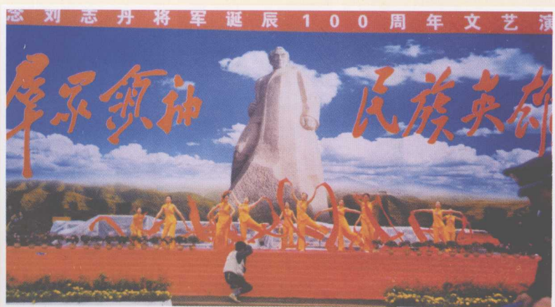
2003年纪念刘志丹将军诞辰100周年文艺演出