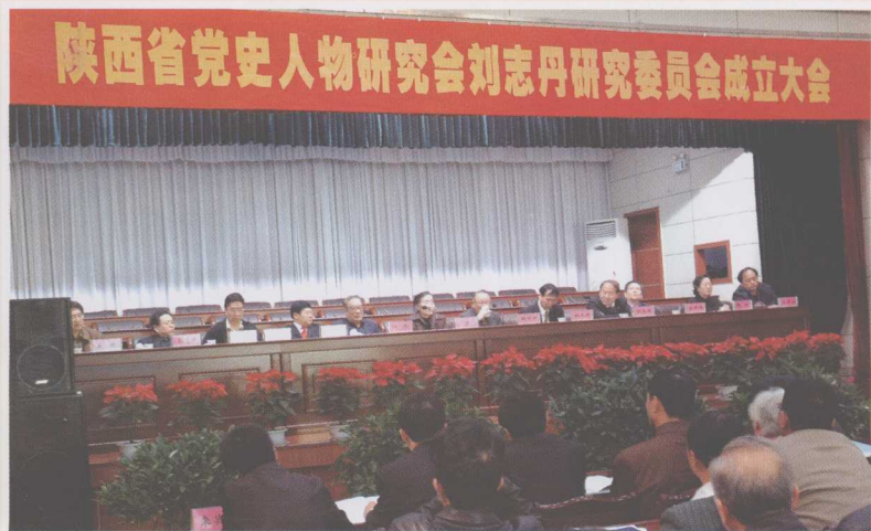
2006年陕西省党史人物研究会刘志丹研究委员会成立大会