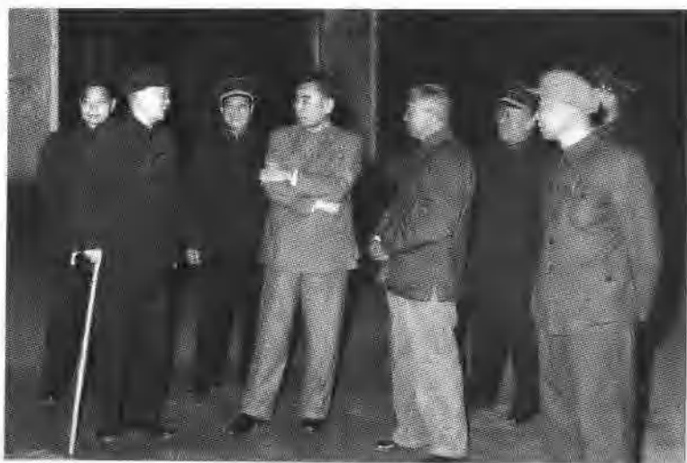
周恩来会见黄埔师生