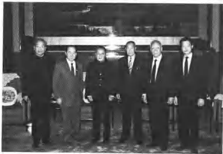
邓小平会见台湾黄埔同学会成员