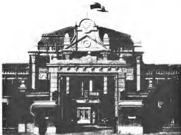
南京中央軍事政治學校校址