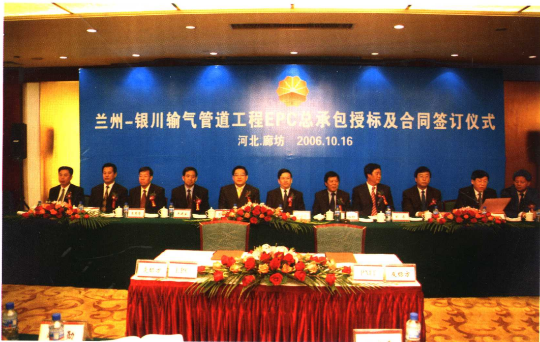
兰州—银川输气管道工程EPC总承包授标及合同签订仪式