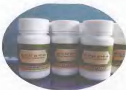
——复方灯台叶片 独特止咳作用的傣医制剂