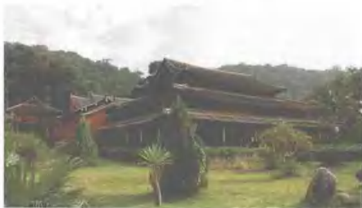
中国唯一保存完整的傣王宫 (始建于1406年,具600年历史)