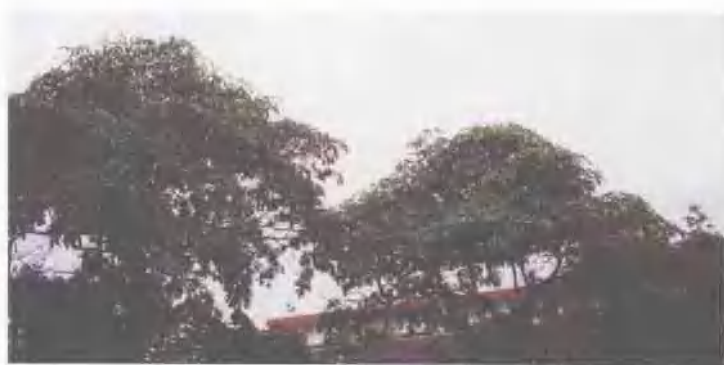
灯台树(傣名 埋丁别)