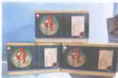
治疗痔疮药剂 ——痔得好口服液