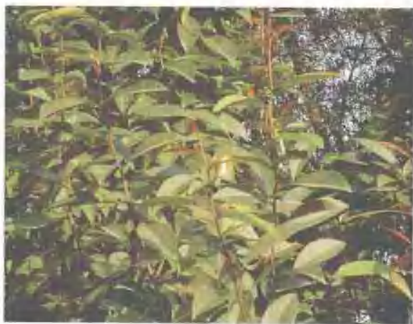
具有抗癌作用的植物——美登木树