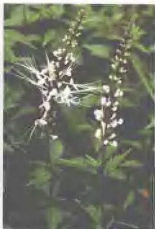
猫须草，又名肾茶（傣名雅糯妙）