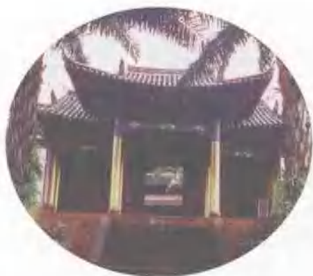
蕴含丰厚傣族文化的建筑群 ——思茅孟连宣抚司衙署