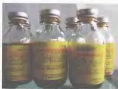
——镇痛搽剂 傣药特色外用制剂