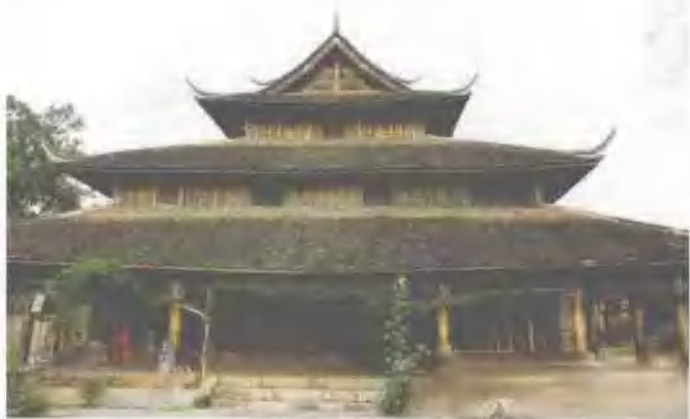
傣王宫大殿(云南唯一融合着傣汉 两族建筑风格的古代砖木建筑)