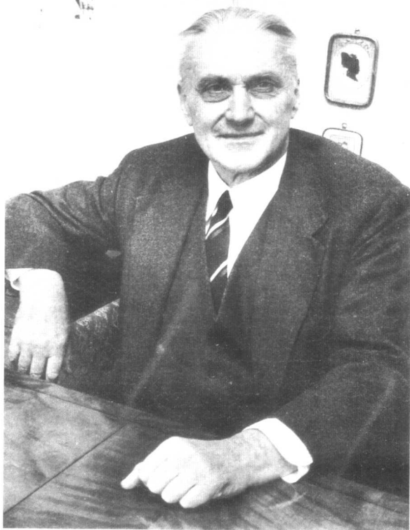
拉格纳·弗里希 Ragnar A. K. Frisch (1895~1973)

奥斯陆大学经济学院教授。1969年因对“发展和应用动态模式于经济过程分析中”所做出的贡献，荣获诺贝尔经济学奖。