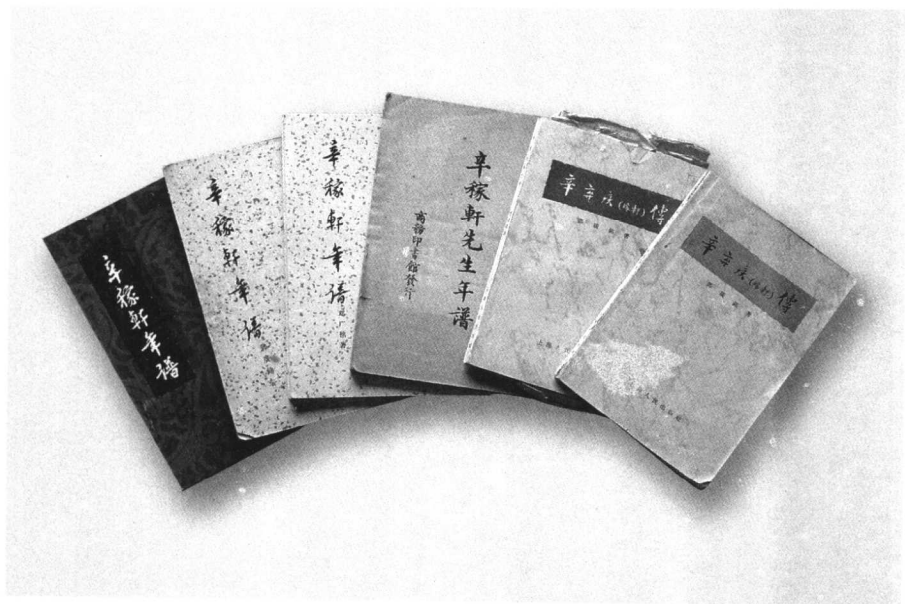
不同版本的《辛弃疾传》《辛稼轩年谱》