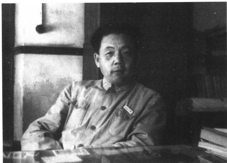
1952年作者在北京东厂胡同1号书斋内