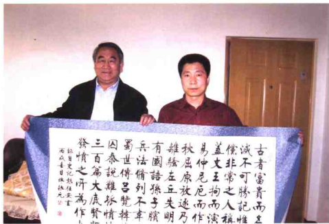
航天英雄楊立偉收藏陳振元先生書法作品時兩人合影留念