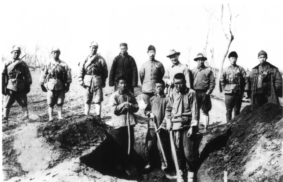
1929年春，第二次发掘殷墟