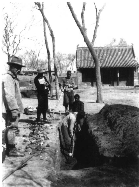
1929年，在小屯马王庙发掘情形