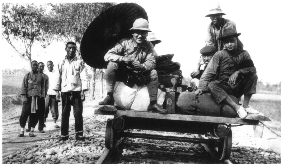
1929年安阳，李济和董作宾在压道车上