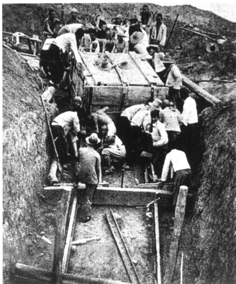
H127坑出土甲骨灰土柱搬运的情形