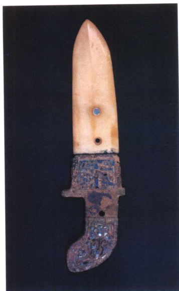
带青铜柄的硬玉戈