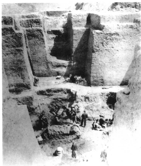
1934—1935年安阳侯家庄一〇〇一号大墓开掘时的情形