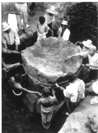
1936年6月13日，殷墟第十三次发掘出土完整的甲骨灰土柱（H127）