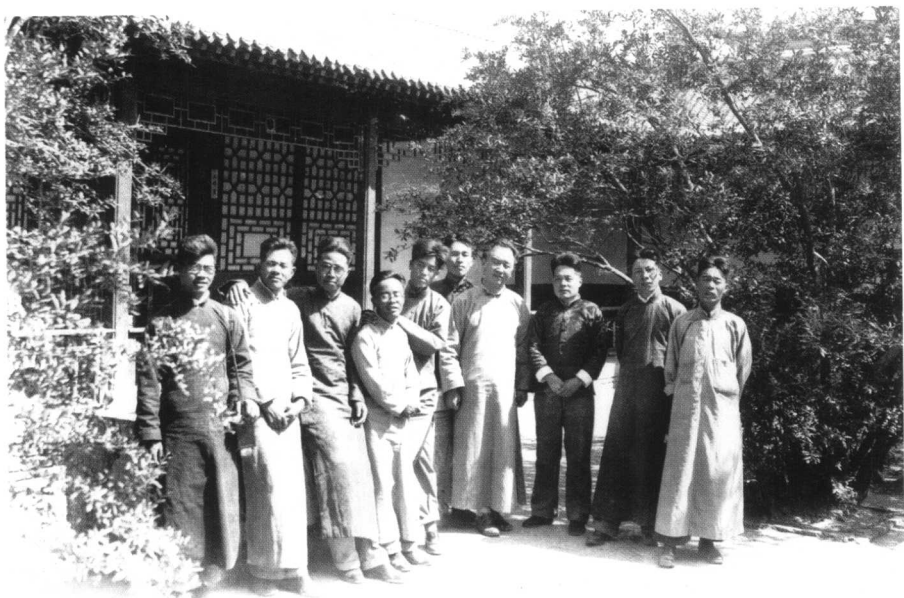
1935年春，欢迎李济视察殷墟发掘团时的合影。左起：王湘、胡厚宣、李光宇、祁延霏、刘耀(尹达)、梁思永、李济、尹焕章、夏鼐、石璋如