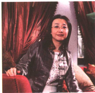
无锡顺驰地产有限公司董事长总经理