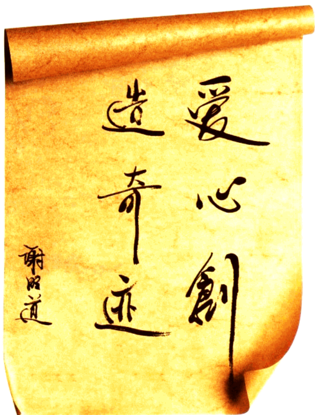
四川省政协副主席谢明道题词