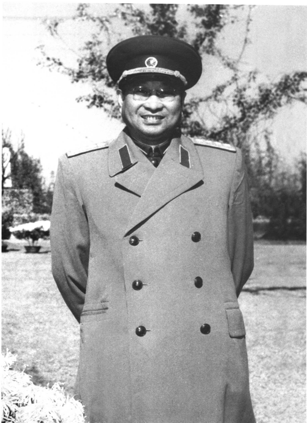
陈 赓 (摄于 1957 年)