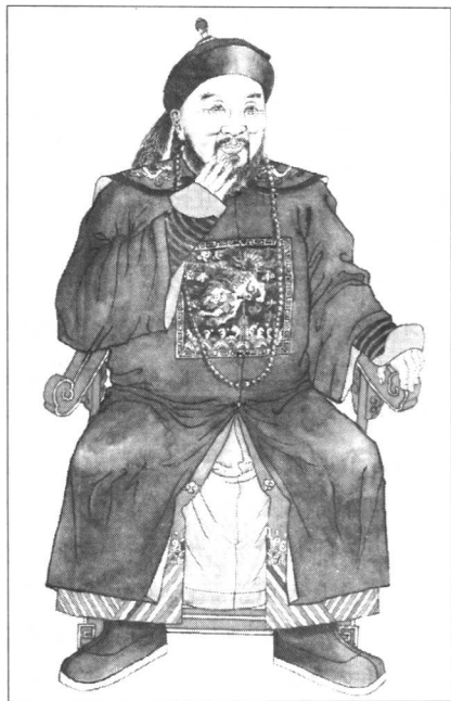
■ 陈赓祖父陈翼琼像

赫赫有名的武将军陈翼琼，放下旌旗战刀回到家中“热心公益慈善诸事。灾荒之年不惜卖田贷粮与本乡饥民。族中有窘于生计者贷以金，虽不偿亦不较也。老而无依者养之于家，直至安葬。乡里称其子孙之兴系曾祖父厚德之故”。陈知非这一叙述，其实说得还不够，《陈氏族谱》中写道：“他如社会育婴、桥梁、道路、慈善等捐，（陈翼琼）靡不尽赞助”；“乡之西有宝华庵者，为古刹，势将陟，公倡募重修，得以不圯”。