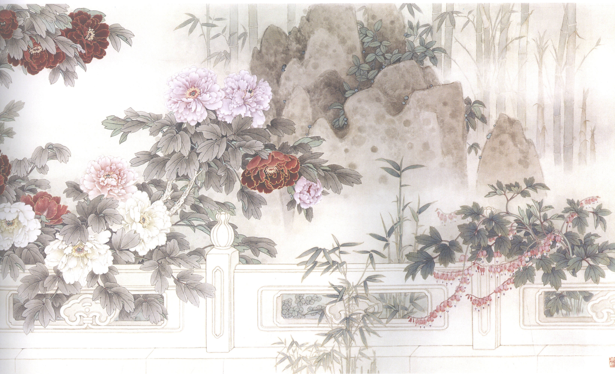
国色天香 140cm × 680cm 2002年