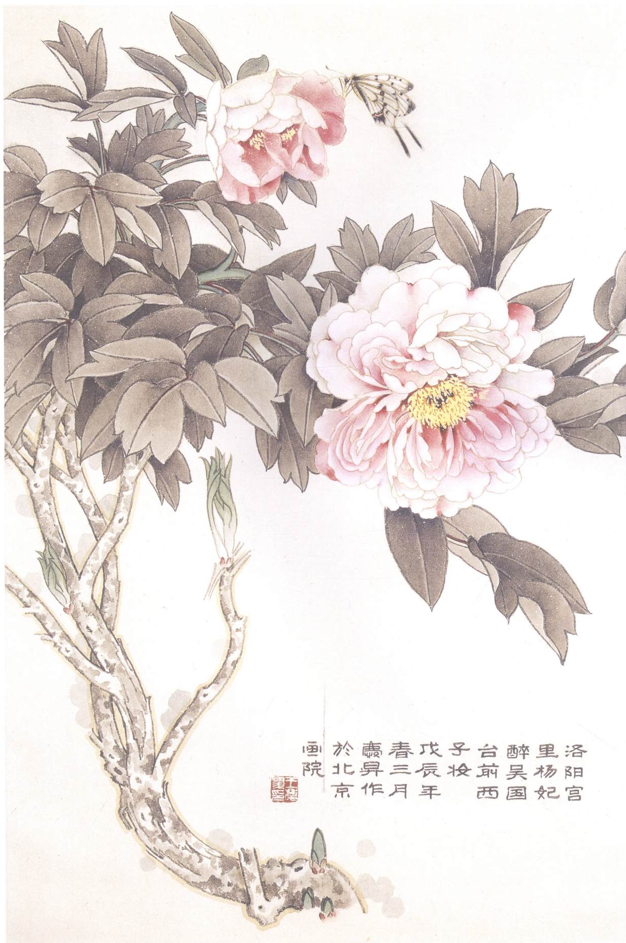
酒醉楊妃 65cm × 43cm 1988年