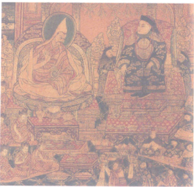
“五世达赖喇嘛朝觐顺治帝图”壁画