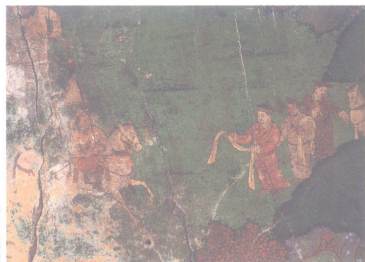
“八思巴拜见忽必烈图”壁画