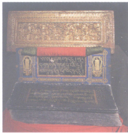
金汁丹珠尔经与经书架

噶丹派是阿底峡的弟子仲敦巴创立。宗旨是一切以佛的言论教导去修法。1056年建热振寺，噶丹派逐渐发展起来。1153年建纳唐寺，纳唐寺的印经院最为驰名。13世纪末该寺僧人炯丹热直搜集所有藏译三藏法典，编订出《甘珠尔》和《丹珠尔》的大藏目录刻版印行，这里印出的经书称纳唐版。