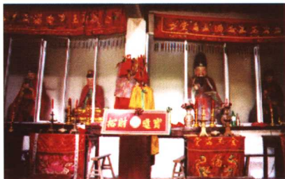
明正德胥王庙被毁后，胥口当地百姓民间捐资建造的“胥王庙”，庙内供奉本府老爷及伍子胥。（拍摄于2002年）