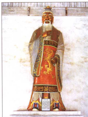
盐官镇海神庙内供奉着的伍子胥立像