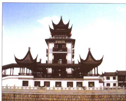
2006年苏州市吴中区胥口镇新建的胥王园（胥王庙）