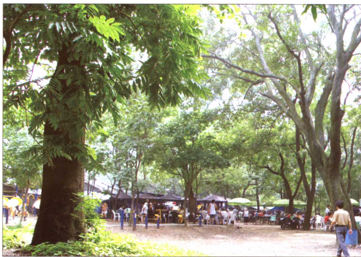
伍公山前，现已成为市民打牌、休息的好地方。（2005年摄）