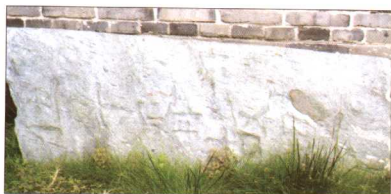
清代“伍子胥故里”碑