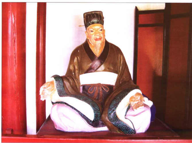
泰伯庙配殿内的伍子胥坐像