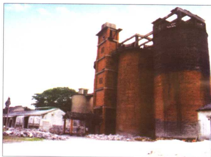
“文革”中胥口胥王庙被毁后，在胥王庙原址所建成的胥口石灰厂。