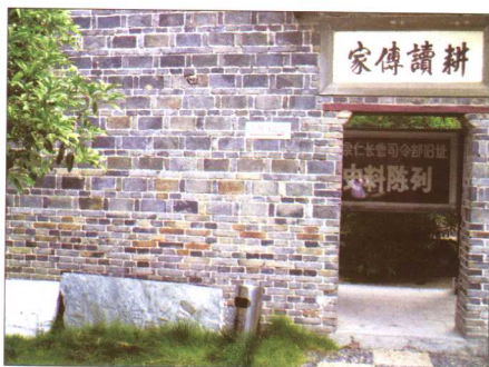
“伍子胥故里”碑现藏于老河口市博物馆院内