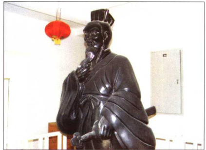
胥王园内的伍子胥坐像（左）和立像（右）