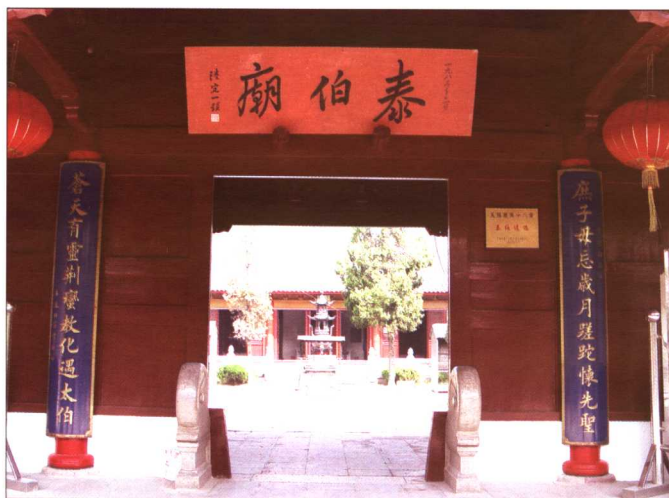
无锡梅村纪念吴国开国君王泰伯的泰伯庙