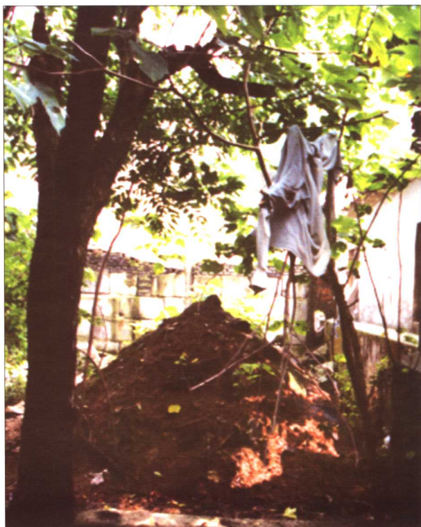
胥口石灰厂 内在胥王庙子胥 墓原址垒起的 伍子胥墓（拍摄于 2001年）