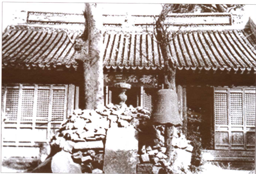
明正德年间所建的胥口胥王庙，“文革”中被毁。