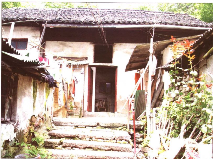
杭州吴山支脉伍公山上的伍公庙，清咸丰年间毁于太平军战火，上为毁后重建的伍公庙，已不复旧观，现为民居。（2005年摄）