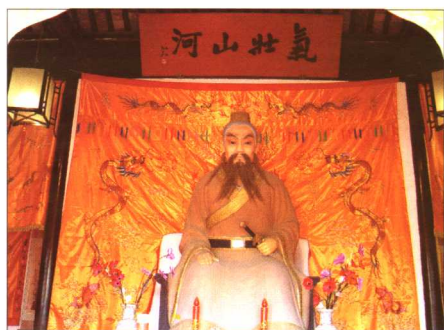
伍相祠内的伍子胥坐像（左为2002年摄，右为2005年摄）