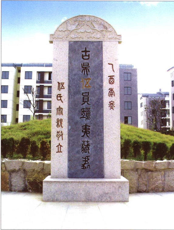
胥王园内的伍子胥墓