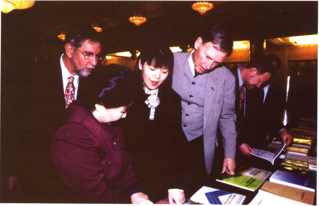
中国地质环境监测院科技成果展引起了有关领导和专家的极大兴趣