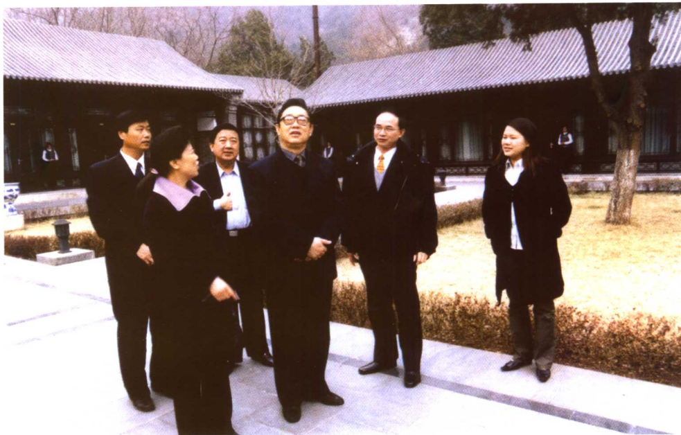
国土资源部部长孙文盛、部党组成员、办公厅主任王世元视察中国地质环境监测院西峰寺培训中心