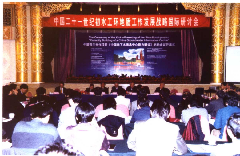
2003年3月24日，中国21世纪初水工环地质工作发展战略国际研讨会在北京召开