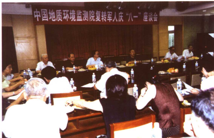
2003年8月1日，中国地质环境监测院召开复转军人庆“八一”座谈会