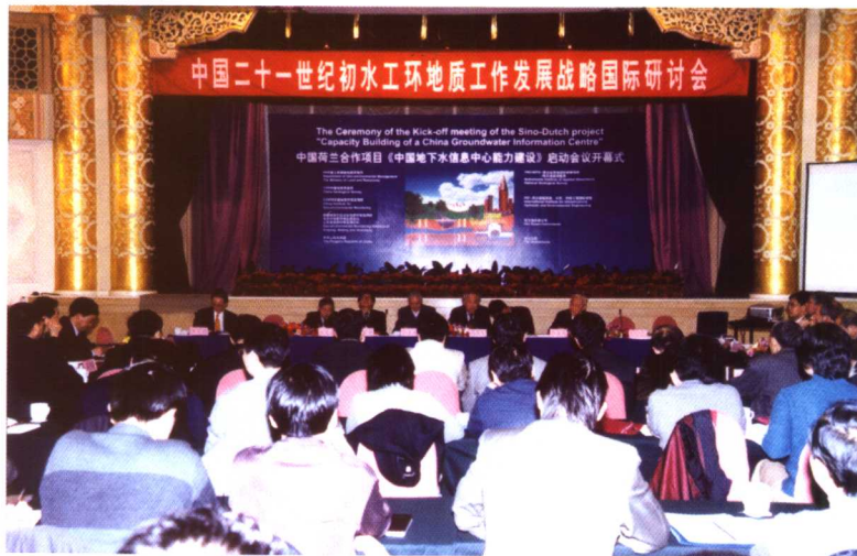
2003年3月24日，中国21世纪初水工环地质工作发展战略国际研讨会在北京召开