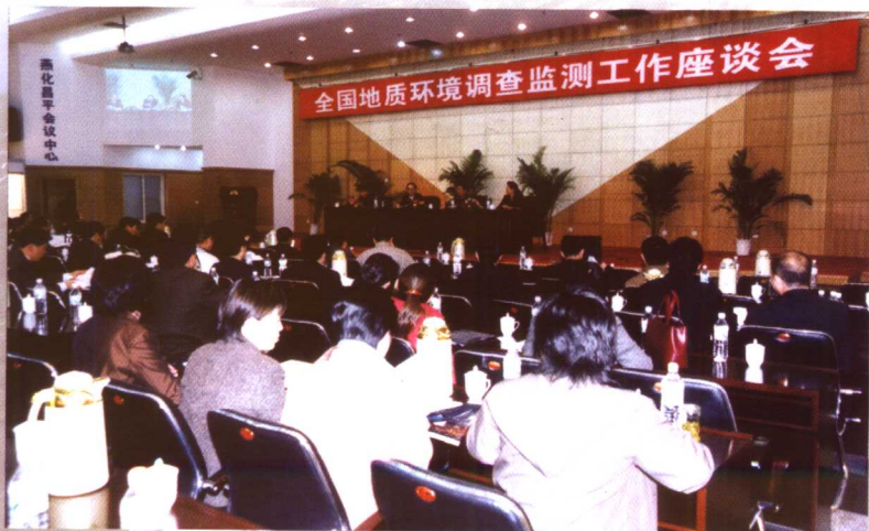
2003年4月19日，国土资源部地质环境司和中国地质环境监测院在北京联合召开全国地质环境调查监测工作座谈会