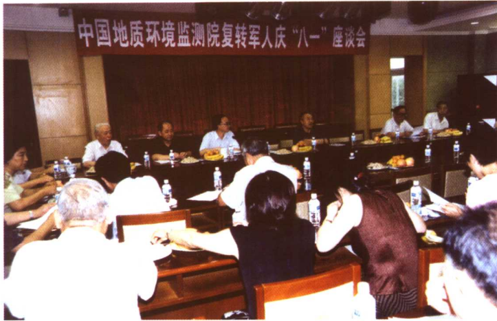
2003年8月1日，中国地质环境监测院召开复转军人庆“八一”座谈会