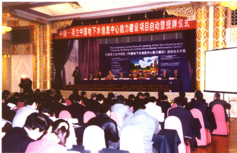
2003年3月24日，中国—荷兰合作项目“中国地下水信息中心能力建设”项目启动暨授牌仪式在北京隆重举行