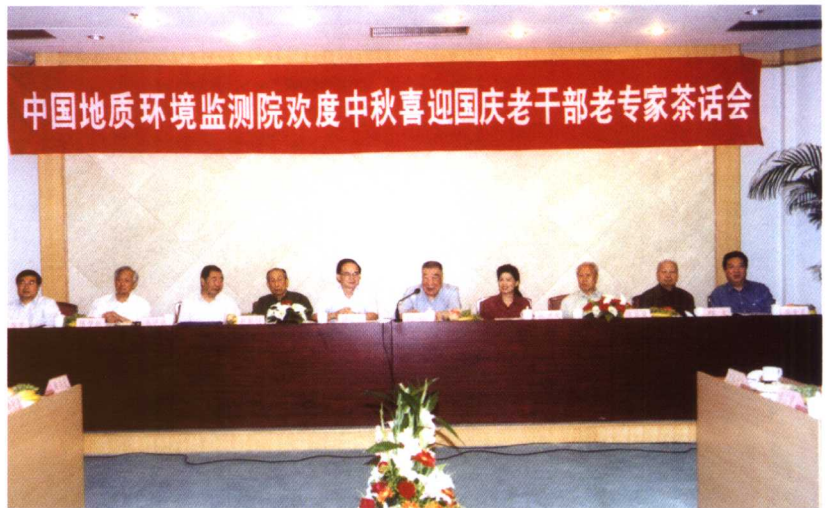
2003年9月10日，中国地质环境监测院召开欢度中秋、喜迎国庆老干部老专家座谈会