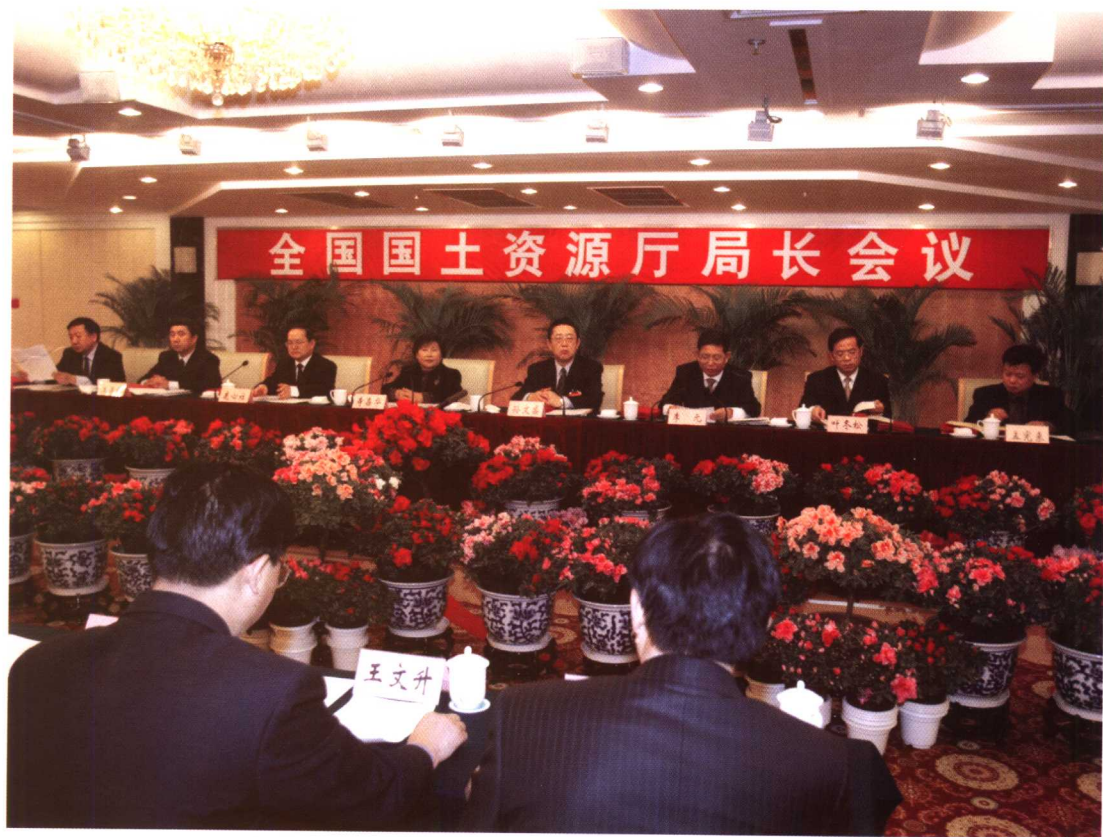
2003年12月17日至28日，全国国土资源厅局长会议在北京召开，国土资源部党组书记、部长孙文盛对抓好地质环境保护和地质灾害监测预防工作提出要求