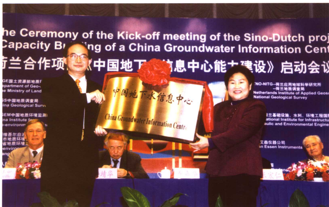
2003年3月24日，国土资源部副部长兼中国地质调查局局长寿嘉华将“中国地下水信息中心”牌匾授予中国地质环境监测院