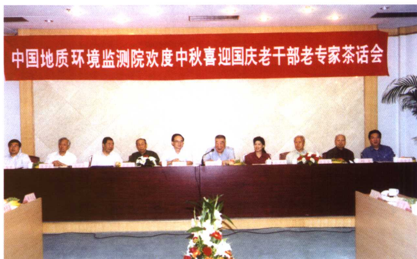
2003年9月10日，中国地质环境监测院召开欢度中秋、喜迎国庆老干部老专家座谈会