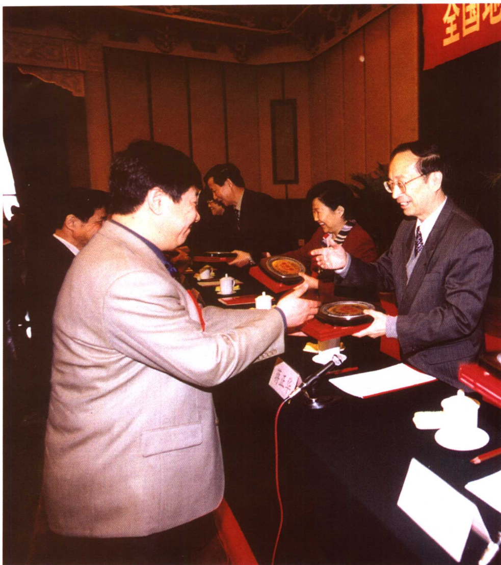
2003年4月18日，全国人大常委会副委员长蒋正华参加全国地质环境管理工作暨地质灾害防治工作表彰会议并向全国地质灾害防治工作先进集体和先进个人颁奖