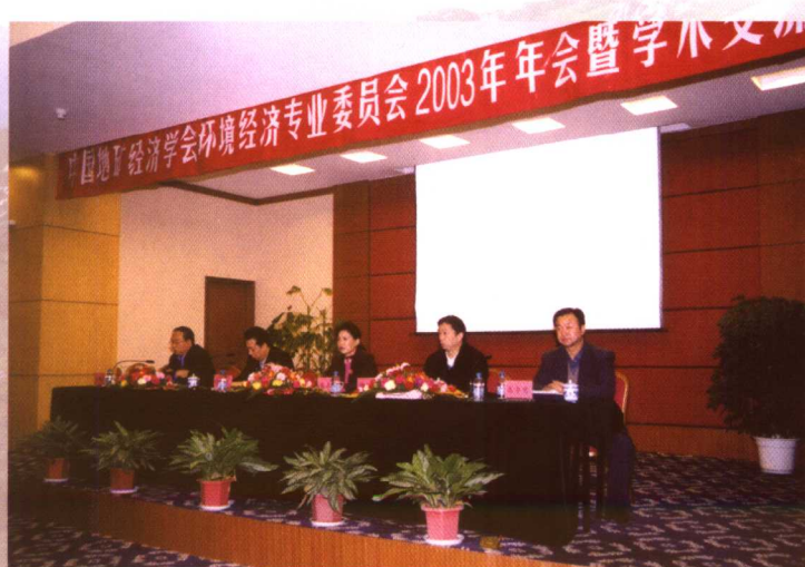
2003年10月11~14日，中国地质环境监测院在新疆乌鲁木齐组织召开了中地矿经济学会环境经济专业委员会2003年年会暨学术交流会