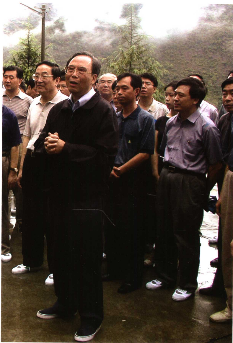
2003年7月16日，国务院副总理曾培炎在湖北省秭归县沙镇溪镇特大滑坡现场视察